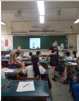
說明：項次 3 成果照片