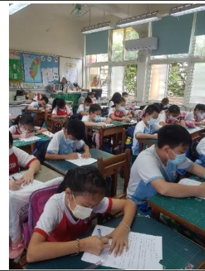
說明：項次 5 成果照片