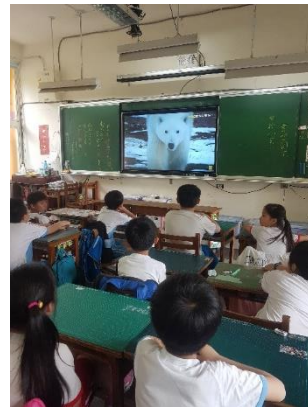
說明：項次 2 成果照片