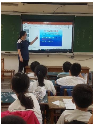
說明：項次 4 成果照片