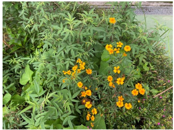
說明：項次 一 成果照片