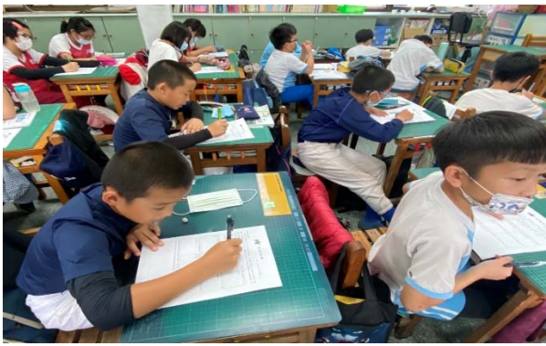
說明：項次 四 成果照片