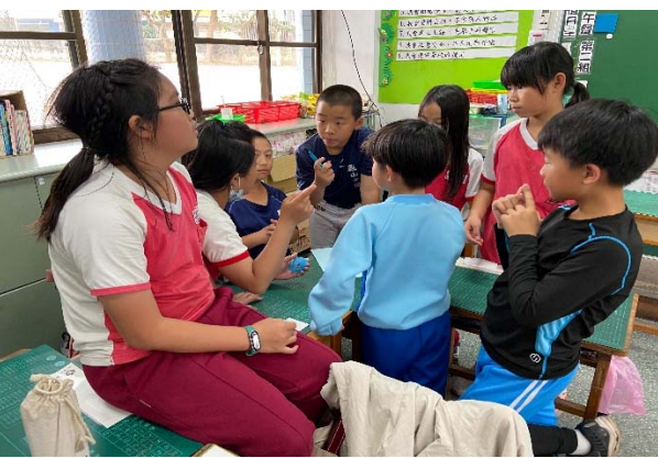
說明：項次 五 成果照片