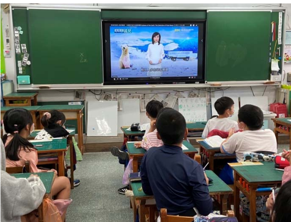
說明：項次 二 成果照片