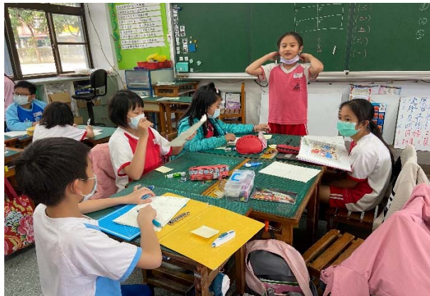
說明：項次 五 成果照片