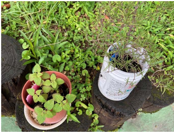
說明：項次 一 成果照片