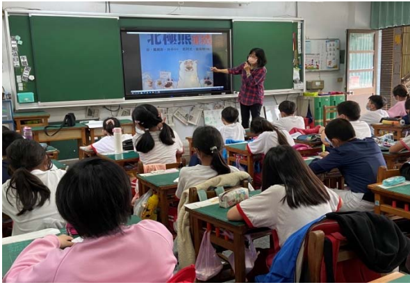
說明：項次 三 成果照片