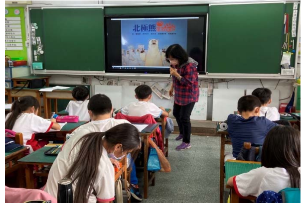
說明：項次 三 成果照片