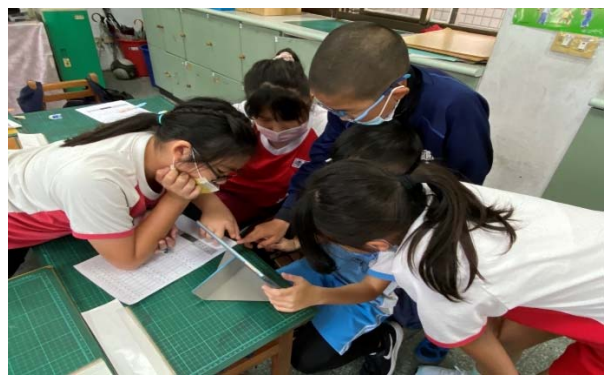
說明：項次 五 成果照片