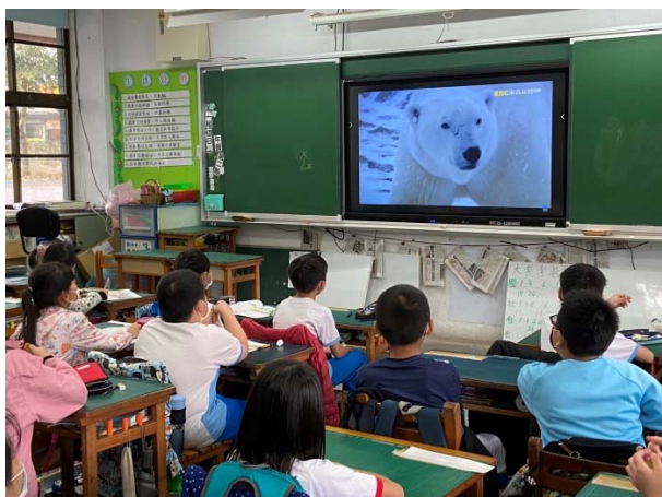
說明：項次 二 成果照片