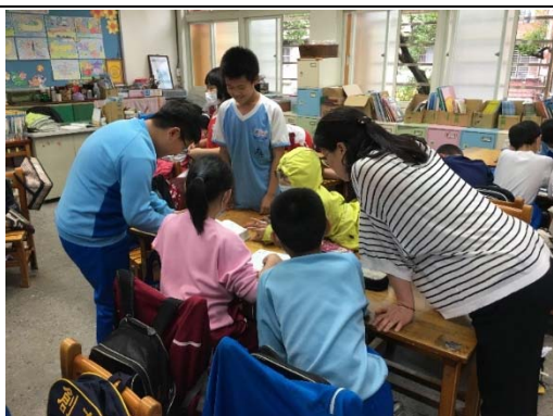
說明：項次 四 成果照片