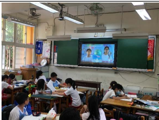
說明：項次 三 成果照片