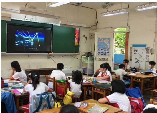
說明：項次 一 成果照片