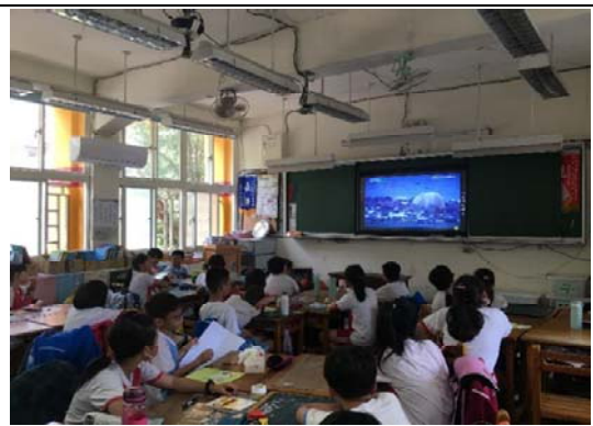
說明：項次 一 成果照片