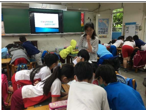
說明：項次 五 成果照片