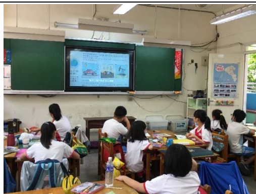
說明：項次 三 成果照片