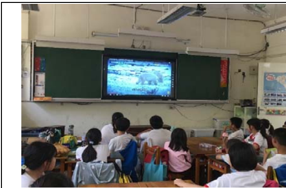
說明：項次 一 成果照片