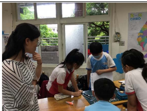
說明：項次 四 成果照片