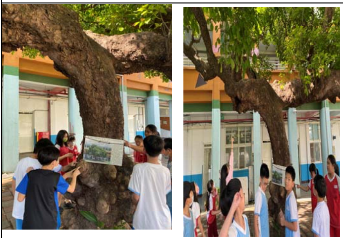
說明：項次 2 成果照片：學生運用四感與茄苳奶奶進行親密接觸。