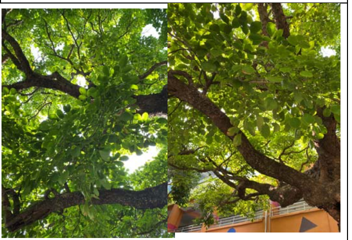
說明：項次 3 成果照片：學生運用四感與茄苳奶奶進行親密接觸。