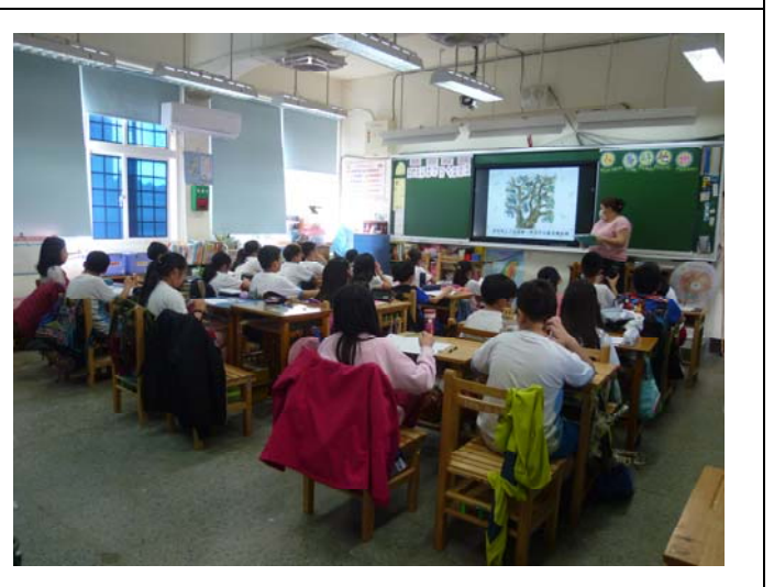
說明：項次 5 成果照片：學生完成我愛校樹學習單，並進行校樹的繪製。