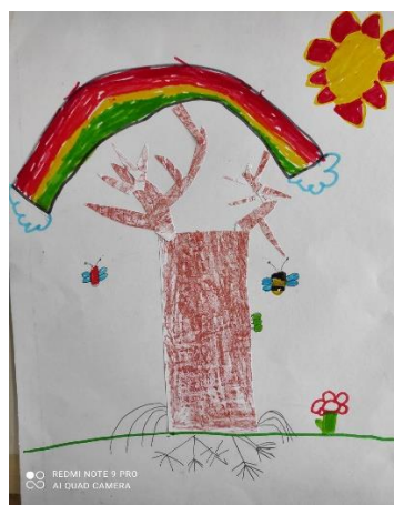
說明：項次四：我們的樹