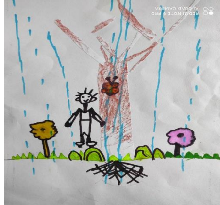
說明：項次四：我們的樹