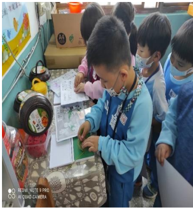
說明：項次四：拓印葉子