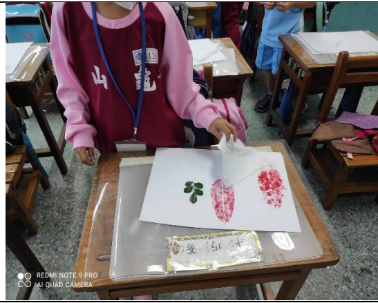
說明：項次四：拓印葉子