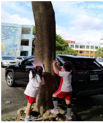
說明：項次四：拓印樹幹