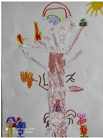
說明：項次四：我們的樹