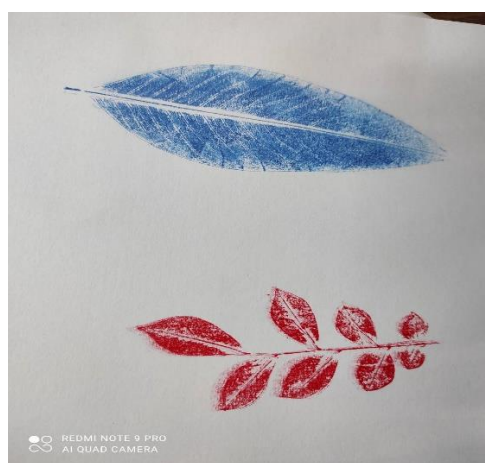
說明：項次四：拓印葉子