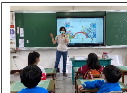
說明：項次 三 成果照片