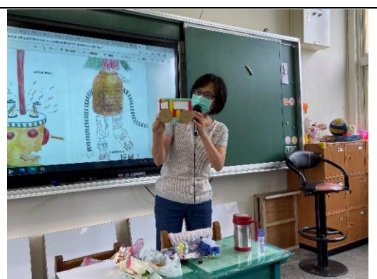
說明：項次 三 成果照片