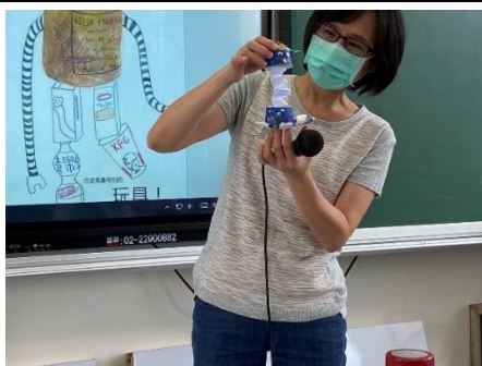
說明：項次 三 成果照片