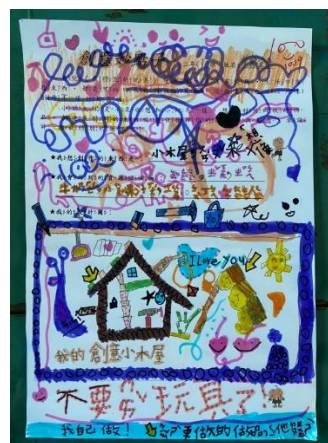
說明：項次 二 成果照片