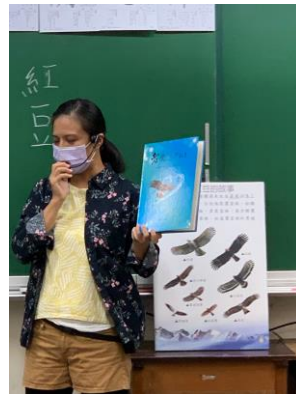
說明：項次 3 成果照片