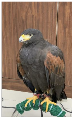
說明：項次 4 成果照片