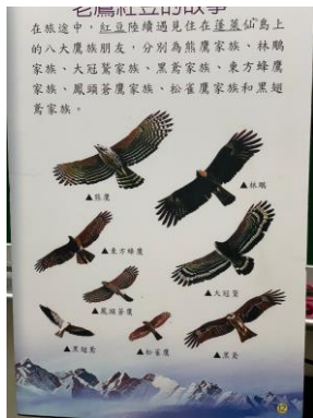
說明：項次 3 成果照片