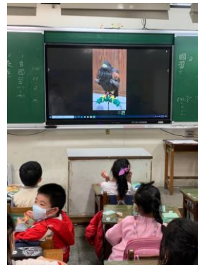
說明：項次 4 成果照片