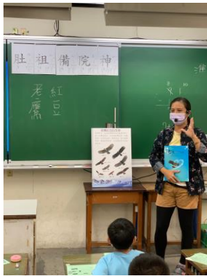
說明：項次 3 成果照片