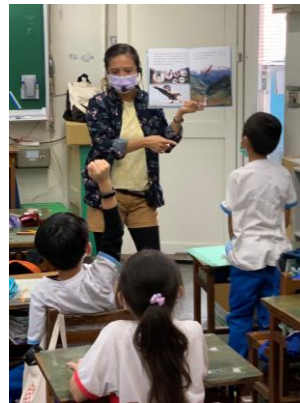
說明：項次 3 成果照片