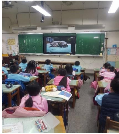
說明：垃圾殘害了自然環境中的海龜