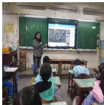
說明：垃圾殘害了自然環境中的鳥類