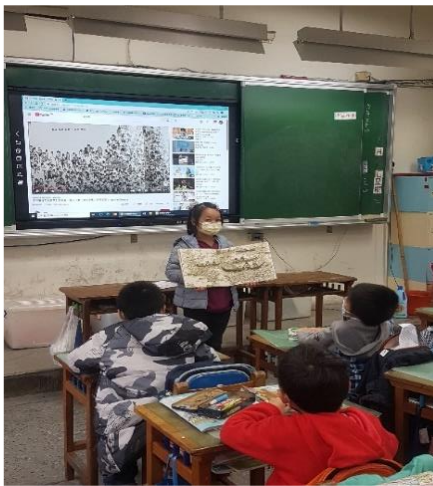
說明：述說垃圾島的心得