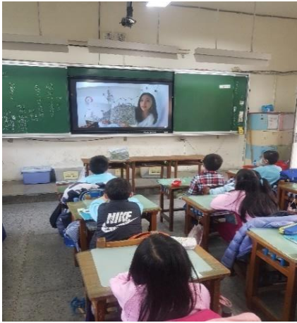
說明：利用繪本介紹垃圾島