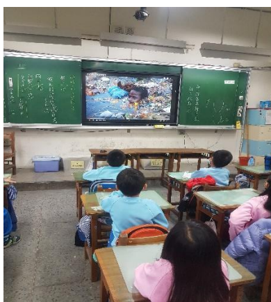
說明：欣賞影片，了解塑膠污染海洋的嚴重性