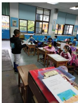
說明：項次 四 成果照片