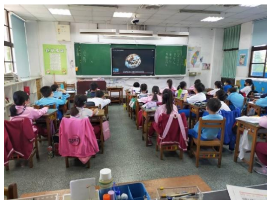
說明：項次 一 成果照片