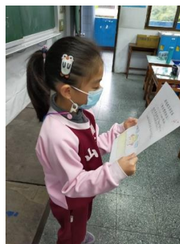
說明：項次 四 成果照片