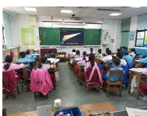
說明：項次 二 成果照片