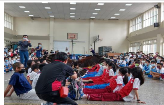
說明：項次 二 成果照片 與老鷹近距離互動