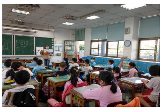
說明：項次 四 成果照片 認真聆聽並踴躍發言