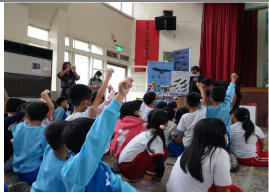
說明：項次 二 成果照片 學生熱烈參與活動