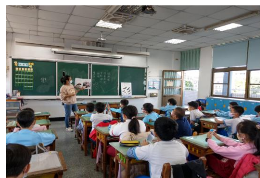
說明：項次 四 成果照片 老鷹紅豆繪本介紹