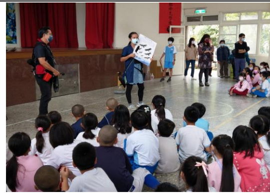
說明：項次 二 成果照片 介紹台灣常見的猛禽類