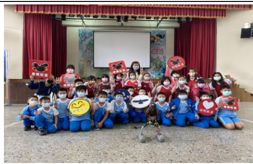
說明：項次 二 成果照片 一包紅豆 一包米 守護老鷹與食安