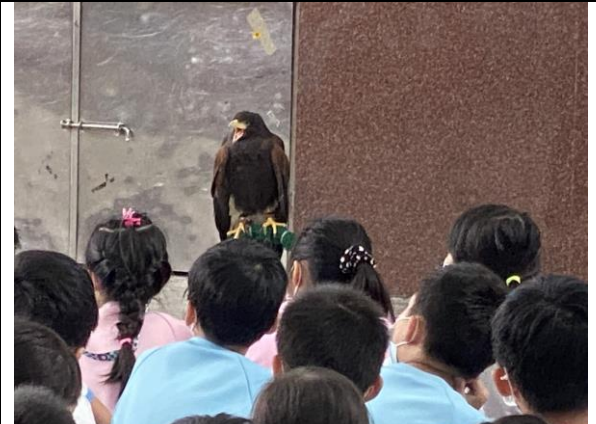
說明：參加老鷹紅豆體驗活動