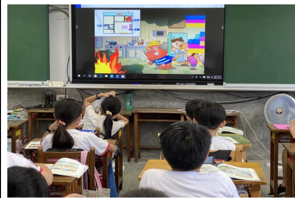
說明：火災逃生影片觀賞及問題討論