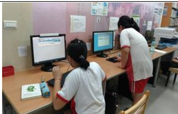
說明：利用電腦搜尋環境教育相關書籍