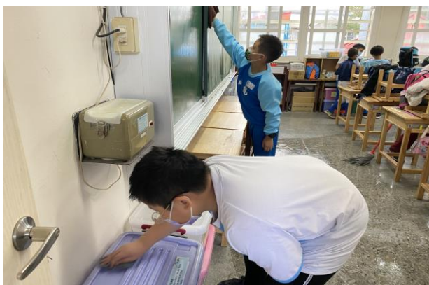
說明：「環境打掃」指導