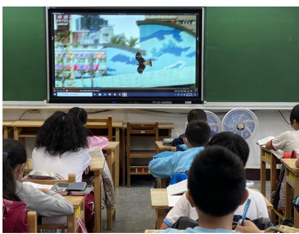
說明：「老鷹想飛」影片欣賞及問題討論