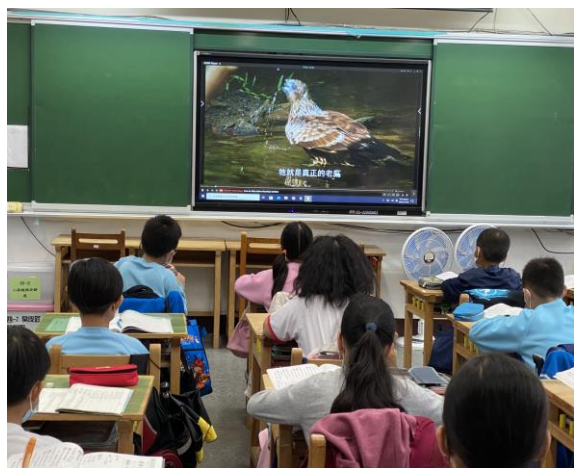
說明：「老鷹想飛」影片欣賞及問題討論