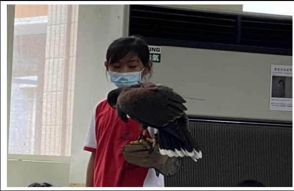
說明：參加老鷹紅豆體驗活動