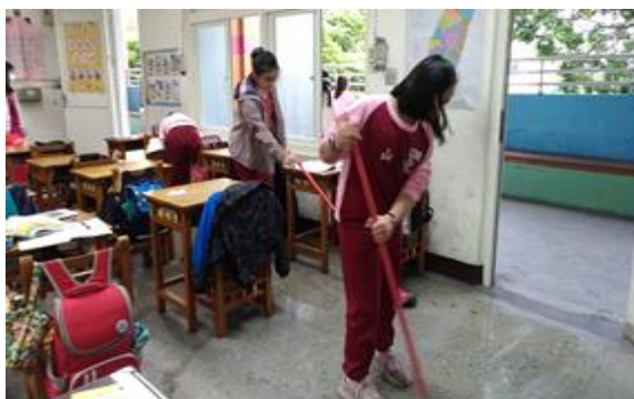
說明：用漂白水消毒教室