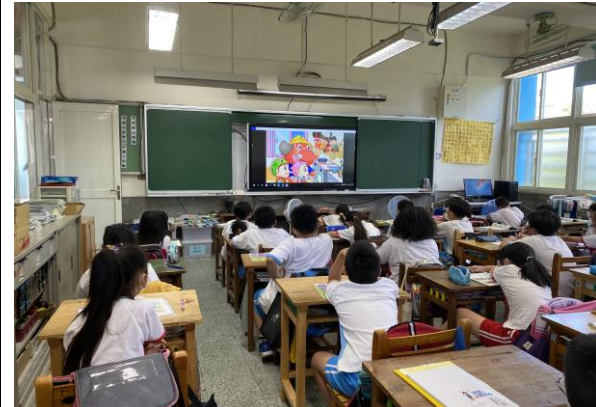
說明：火災逃生影片觀賞及問題討論