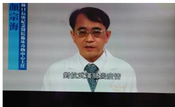
說明：防疫影片宣導