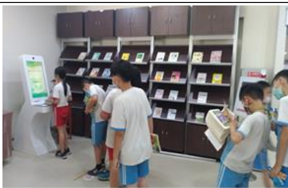
說明：體驗現代化科技對生活環境的影響