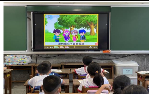
說明：戶外生活影片觀賞與問題討論