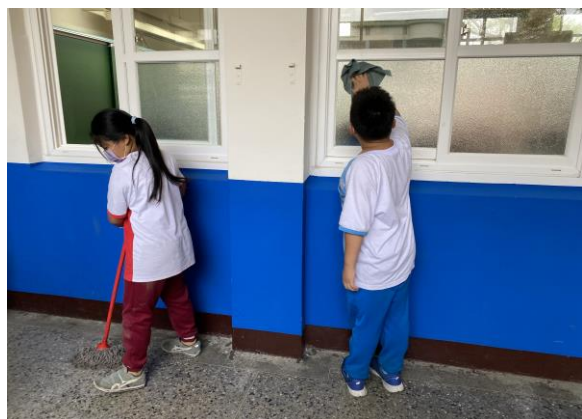
說明：「環境打掃」指導