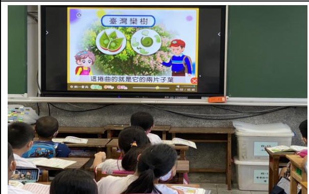
說明：戶外生活影片觀賞與問題討論