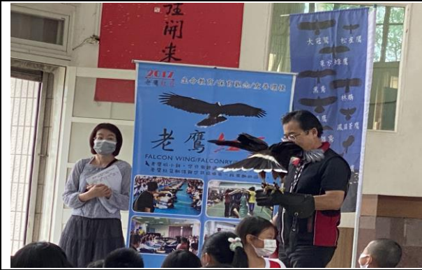
說明：參加老鷹紅豆體驗活動