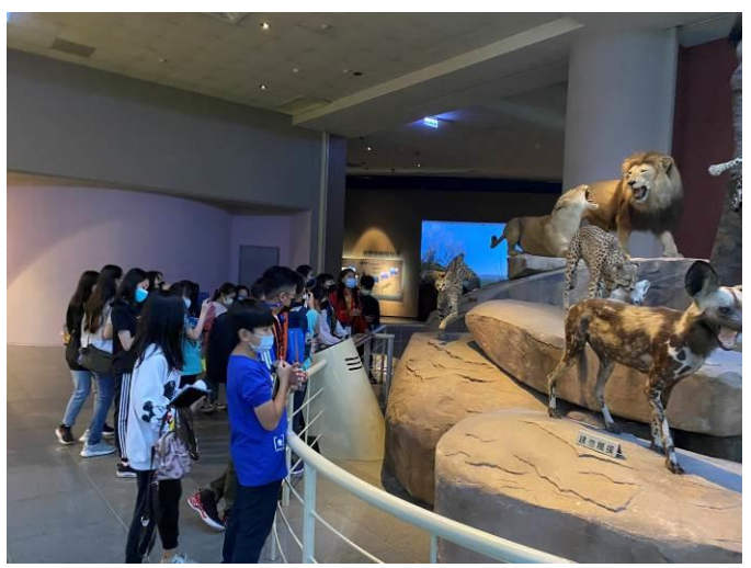
說明：項次 2 成果照片： 在「地球科學廳-芸芸眾生」觀看各種生物 1。