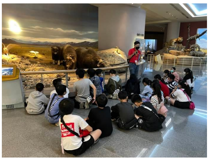
說明：項次 2 成果照片： 在「地球科學廳-芸芸眾生」由領隊進行解說。