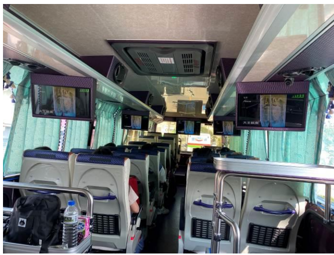
說明：項次 1 成果照片： 車上觀看自然科學博物館導覽-介紹大王魷魚。