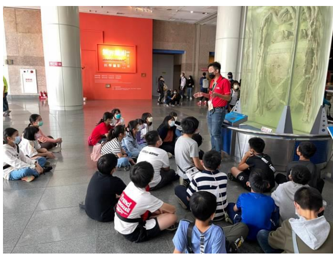
說明：項次 2 成果照片： 實際觀看大王魷魚，並由領隊進行解說。