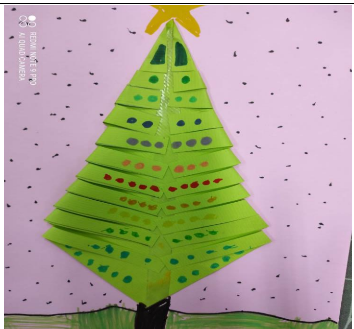
說明：項次四：做出美麗的聖誕樹