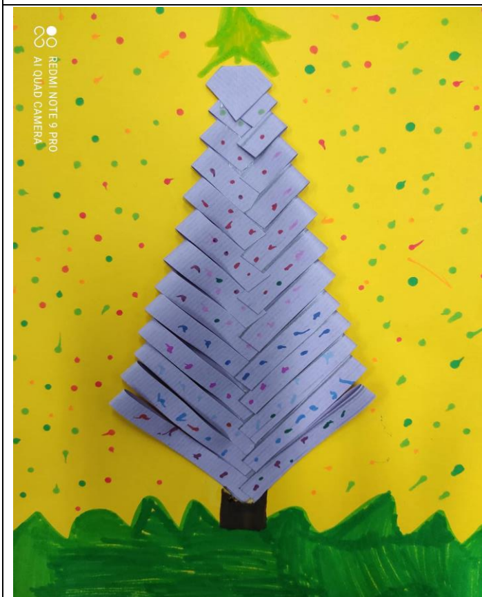
說明：項次三：做出美麗的聖誕樹