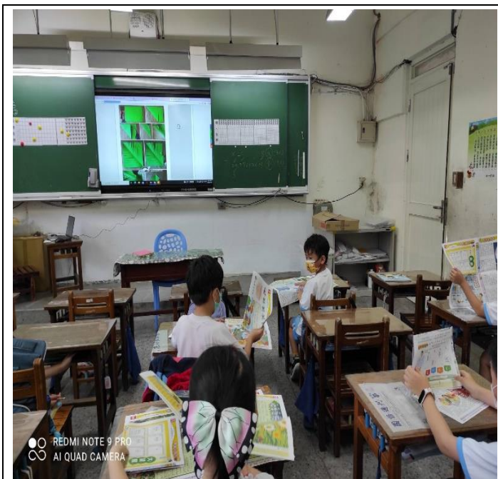
說明：項次三：做出美麗的聖誕樹