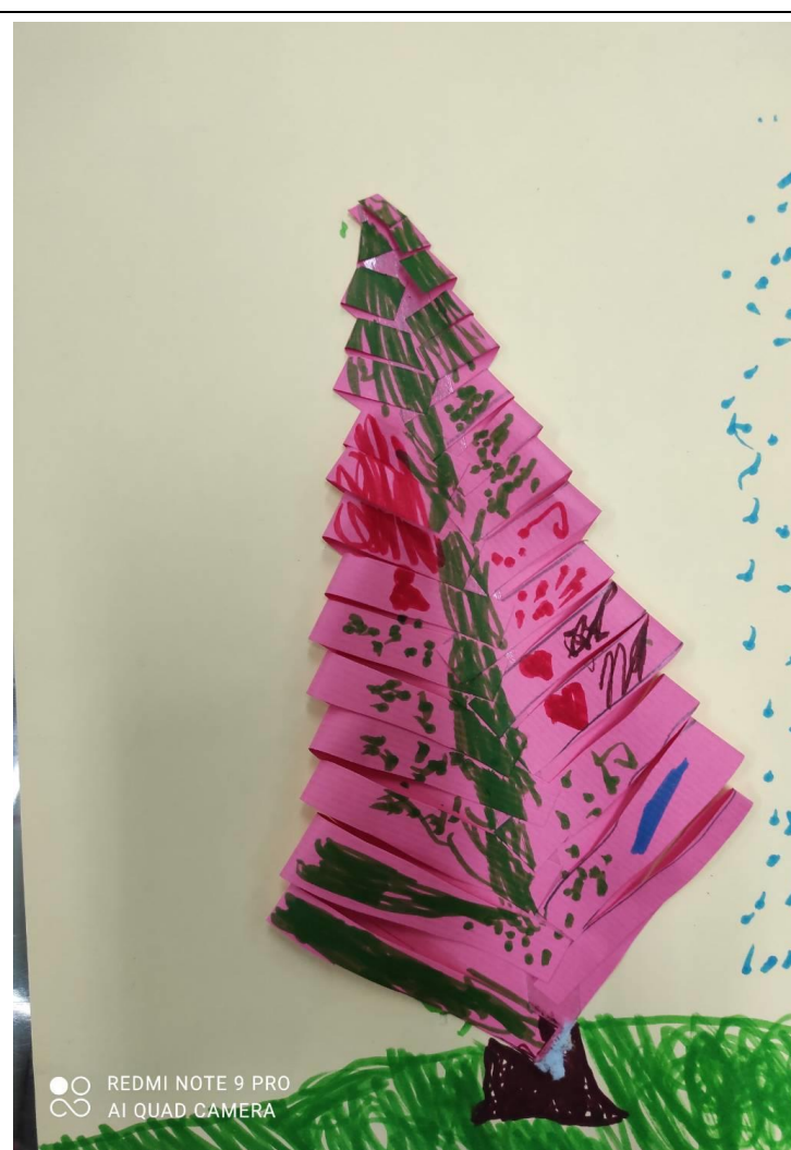
說明：項次三：做出美麗的聖誕樹