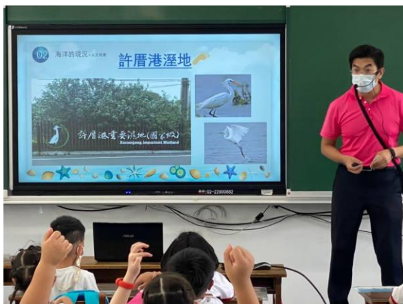
說明：講師介紹環境與海洋生態的關係