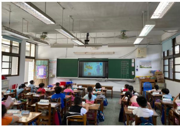
說明：觀賞防災宣導影片