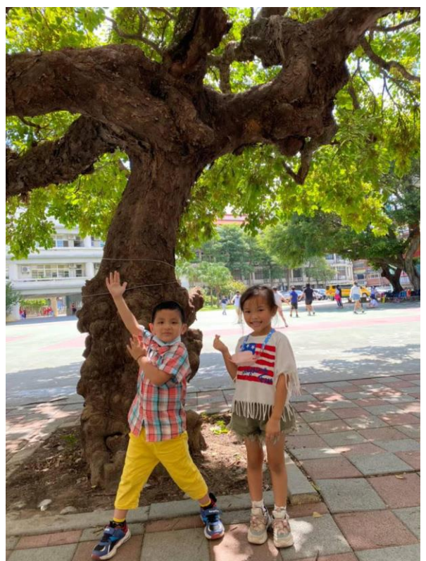
說明：認識學校的樹木