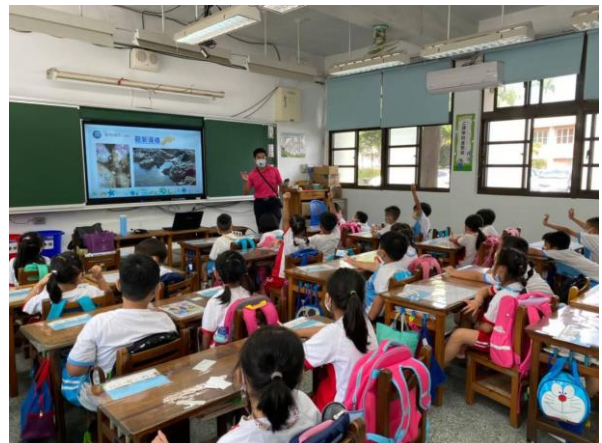
說明：講師介紹環境與海洋生態的關係