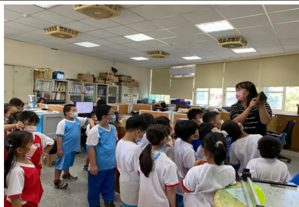
說明：認識各處室及處室主任