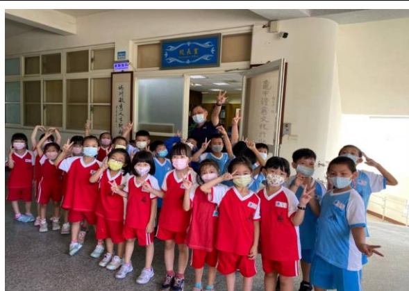
說明：認識校長室位置及拜訪校長