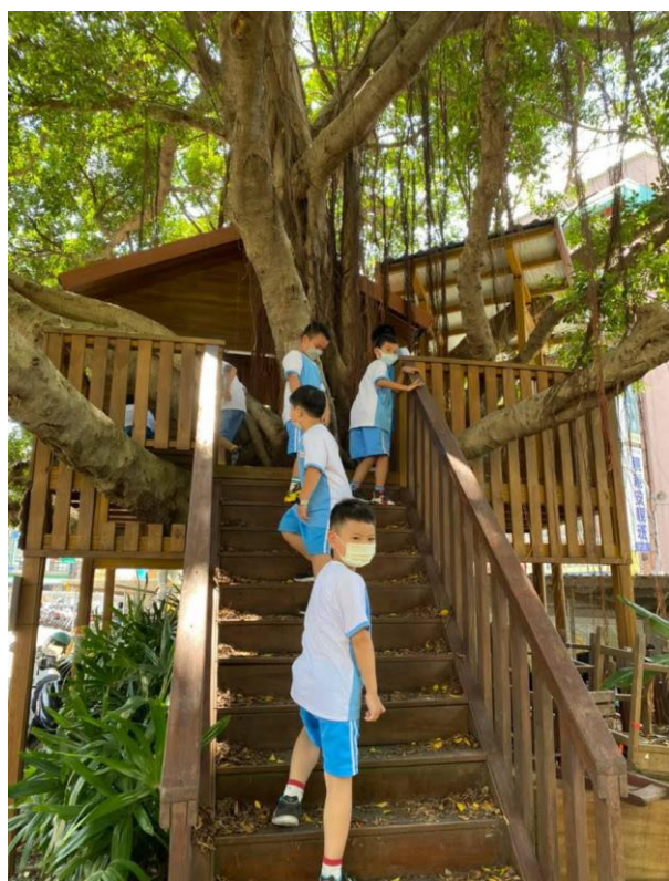
說明：認識學校的樹木