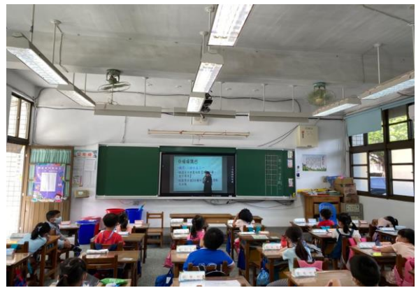
說明：觀賞防災宣導影片