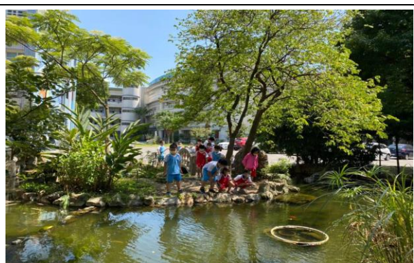
說明：認識水中動植物