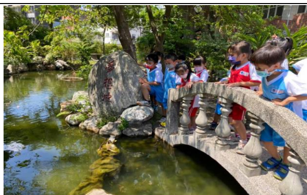
說明：認識水中動植物