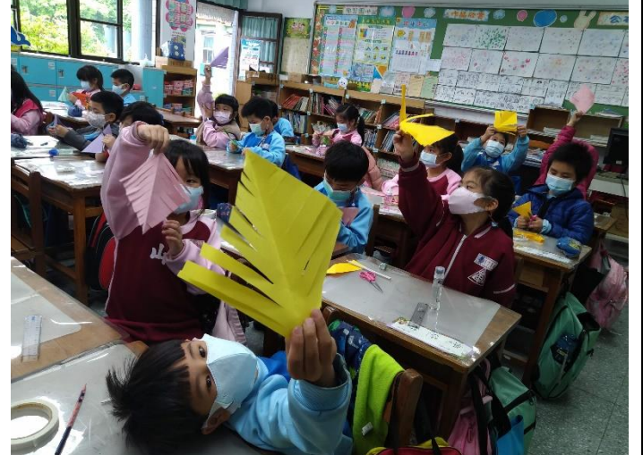
四、教導聖誕樹製作的步驟(摺.畫.剪.黏貼)