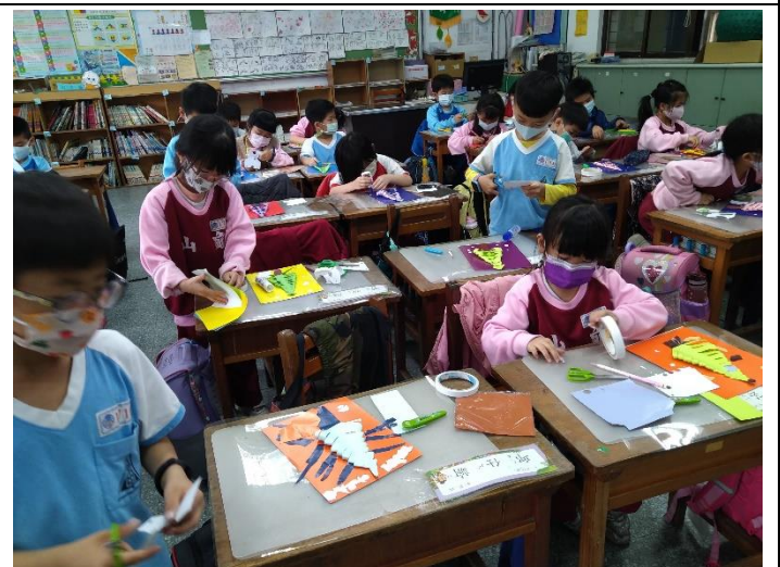
五、設計聖誕樹背景