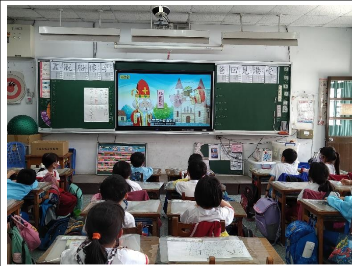
一、觀賞影片~聖誕節及聖誕老公公的由來