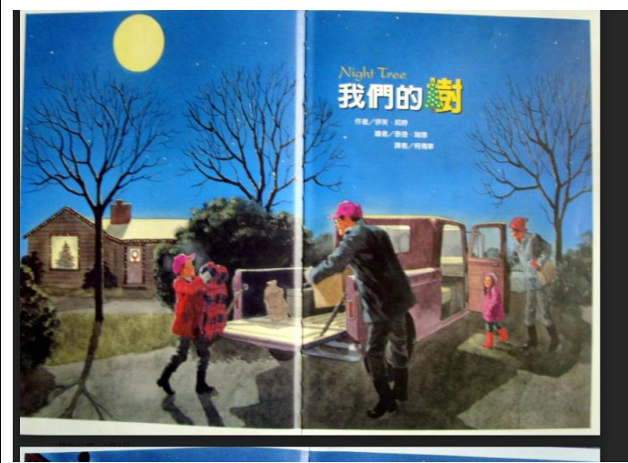
三、繪本導讀~我們的樹