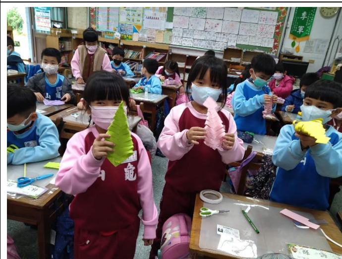
四、完成聖誕樹雛形.