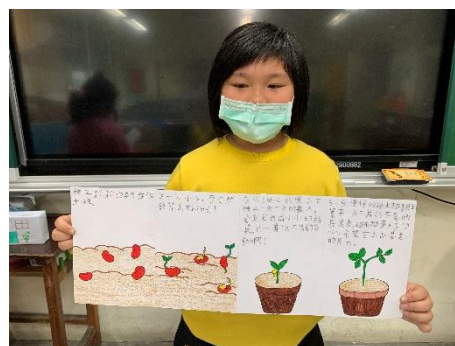
說明：項次 6 成果照片