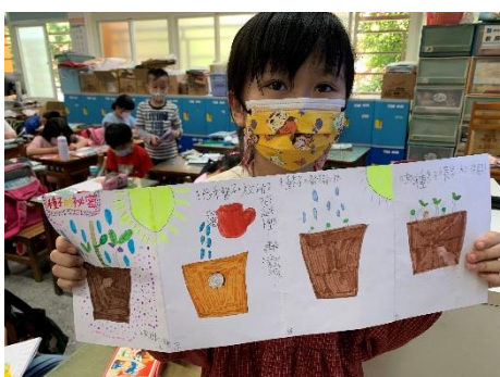
說明：項次 6 成果照片