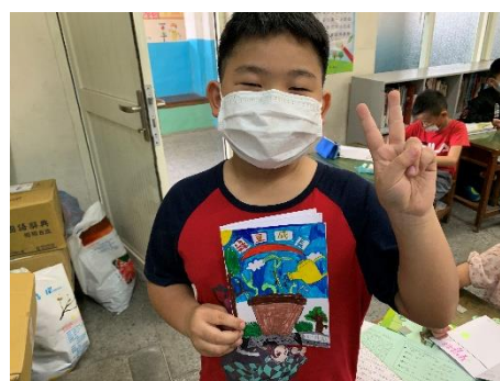
說明：項次 6 成果照片