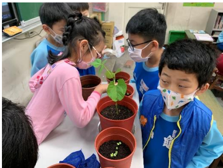
說明：項次 3 成果照片