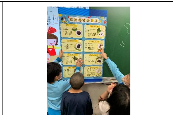
說明：項次 1 成果照片