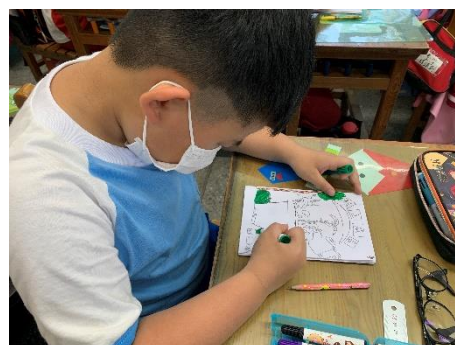
說明：項次 5 成果照片