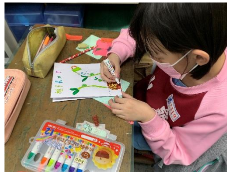
說明：項次 4 成果照片