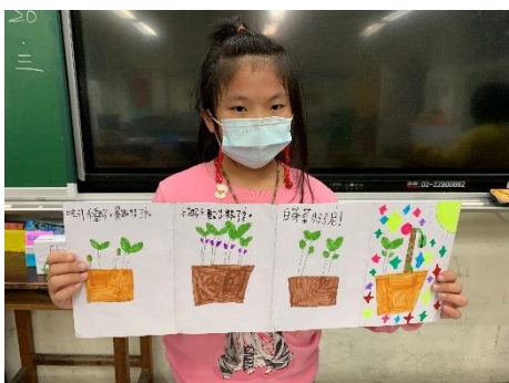
說明：項次 6 成果照片