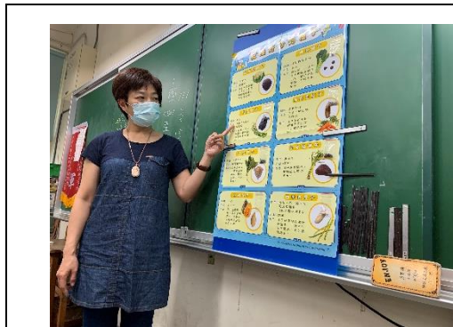
說明：項次 1 成果照片