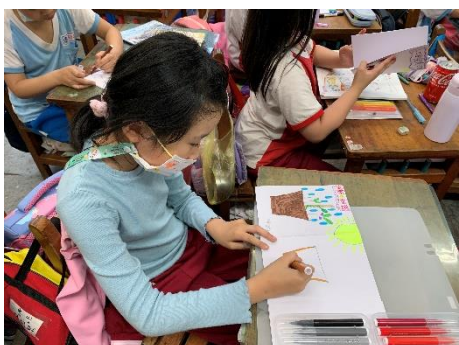
說明：項次 5 成果照片