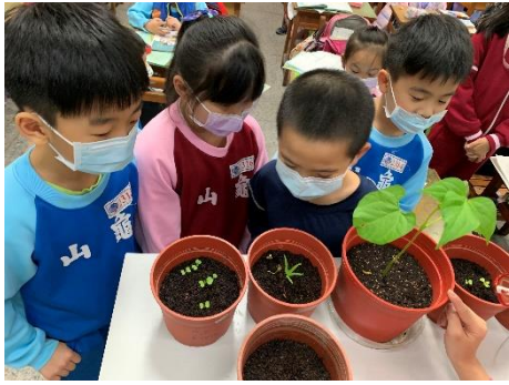
說明：項次 3 成果照片