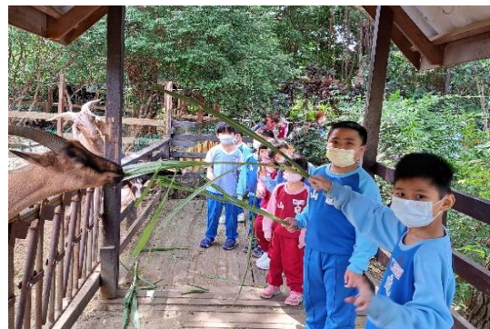
說明：項次 六 成果照片