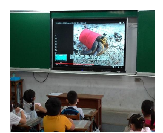
說明：項次 三 成果照片