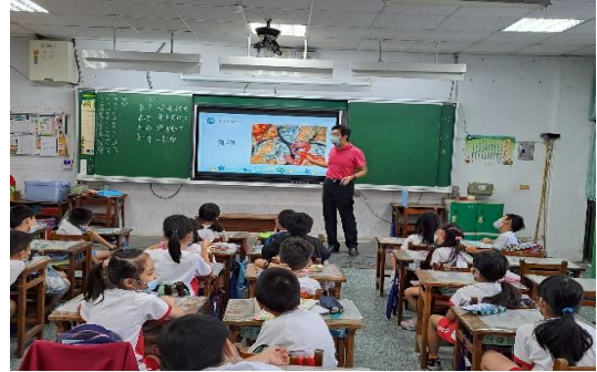
說明：項次 五 成果照片