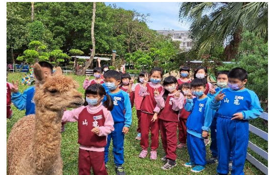
說明：項次 六 成果照片