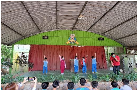
說明：項次 六 成果照片