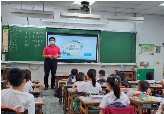
說明：項次 五 成果照片