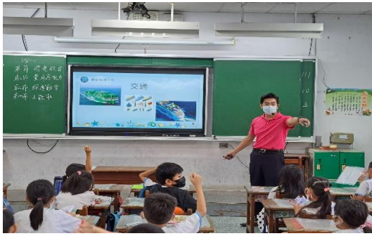
說明：項次 五 成果照片