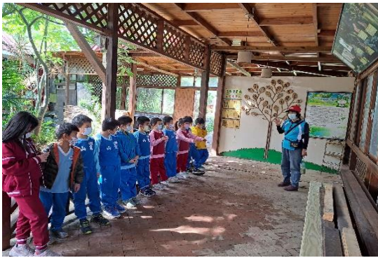
說明：項次 六 成果照片