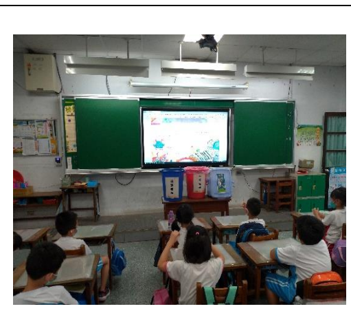
說明：項次 四 成果照片