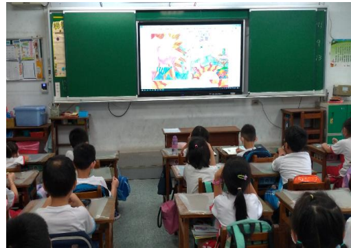
說明：項次 二 成果照片