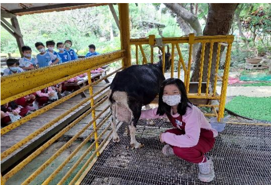
說明：項次 六 成果照片