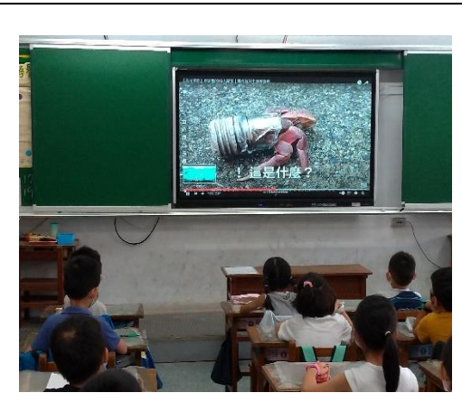
說明：項次 三 成果照片