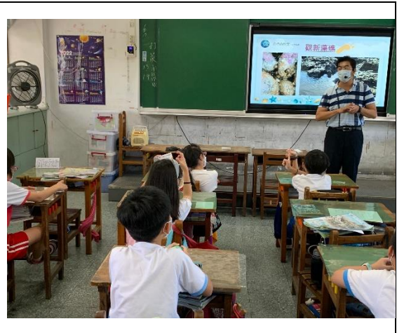
保育「藻礁」影片觀賞與解說