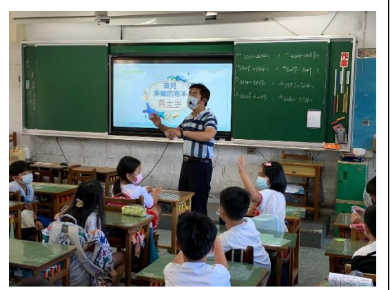
氣候與海洋的關聯