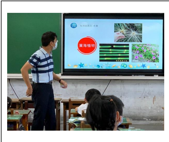
保育「海洋」影片觀賞與解說