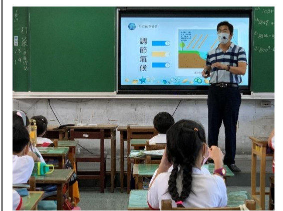
氣候與海洋的關聯