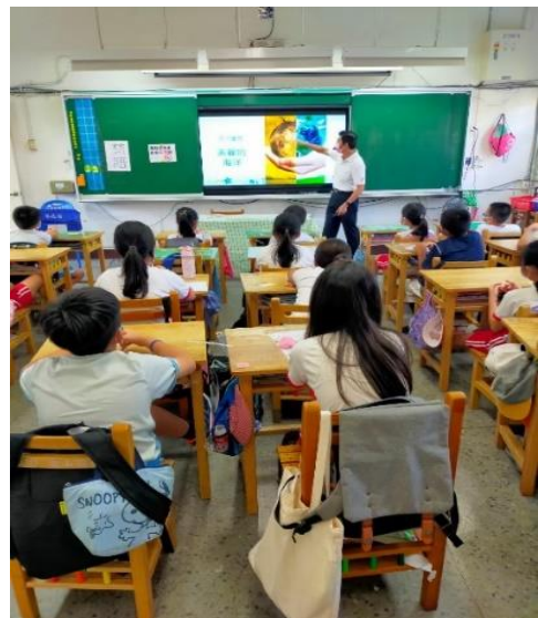
說明：項次 一 成果照片