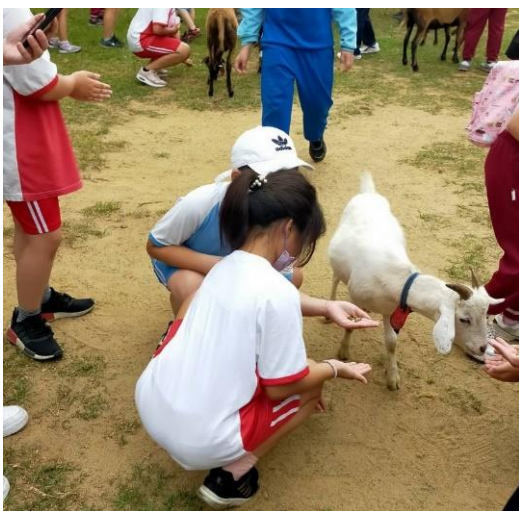
說明：項次 二 成果照片