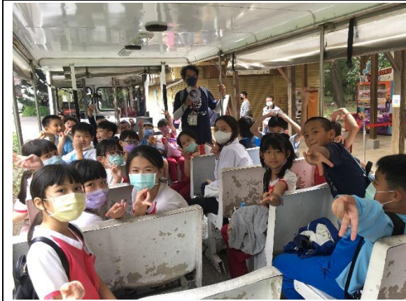
說明：項次 七 成果照片