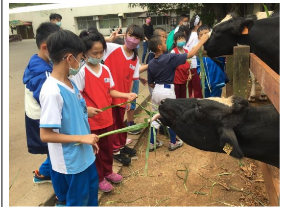
說明：項次 八 成果照片