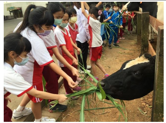
說明：項次 八 成果照片