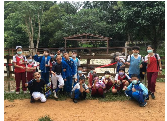
說明：項次 九 成果照片