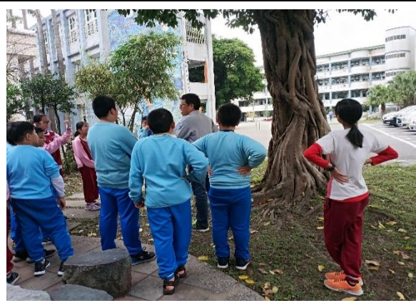
說明：項次 五 成果照片