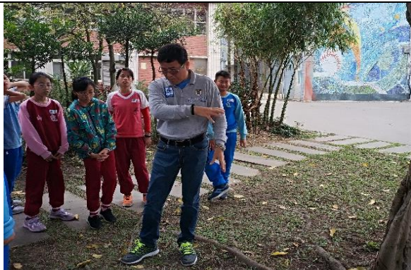
說明：項次 四 成果照片