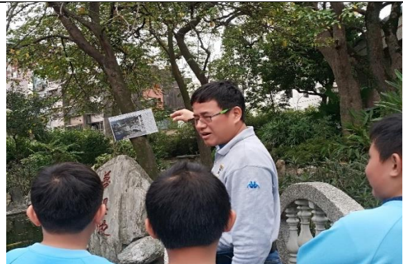
說明：項次 五 成果照片