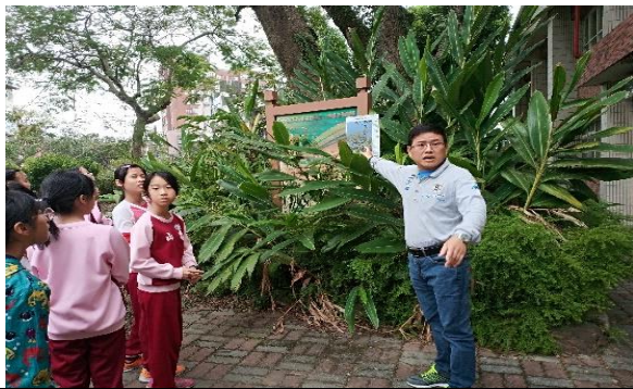
說明：項次 四 成果照片