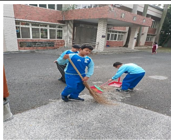
說明：項次 一 成果照片