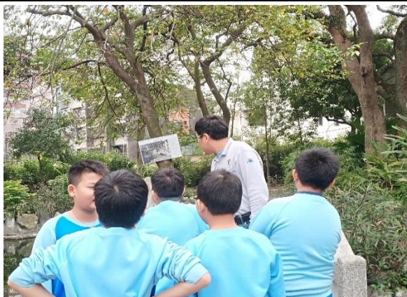
說明：項次 五 成果照片