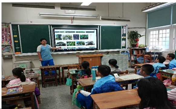
說明：項次 三 成果照片