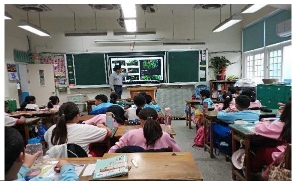
說明：項次 三 成果照片