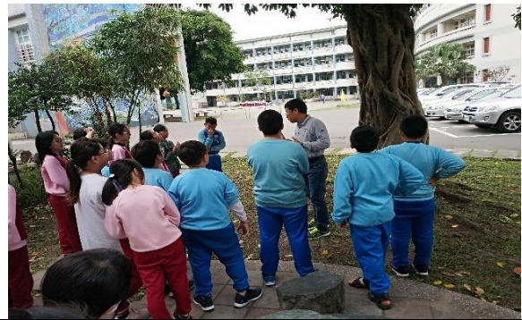
說明：項次 四 成果照片