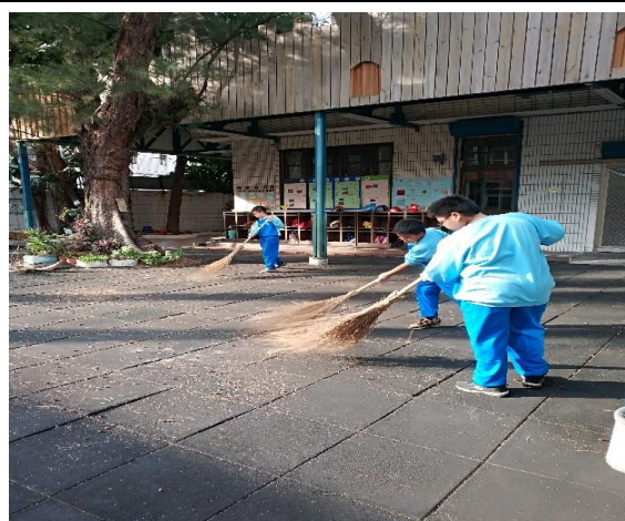
說明：項次 一 成果照片