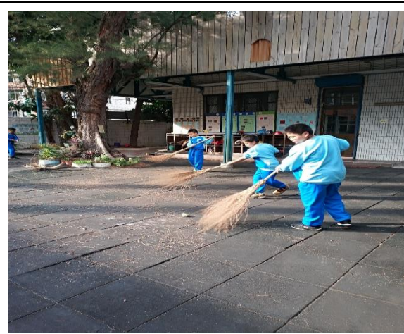
說明：項次 二 成果照片