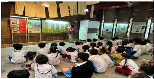
說明：戶外教育參訪