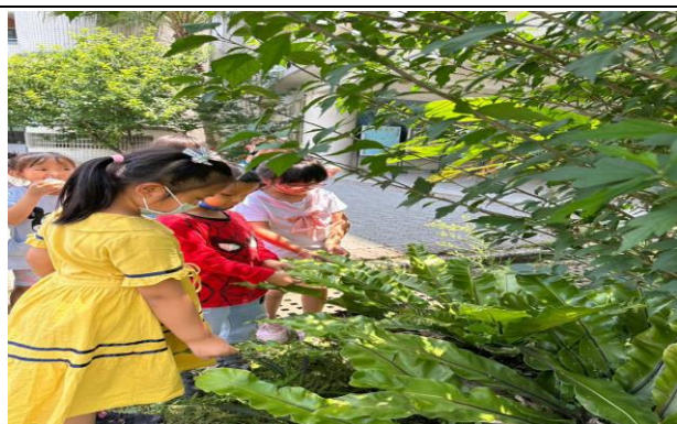
說明：大樹小花我愛你