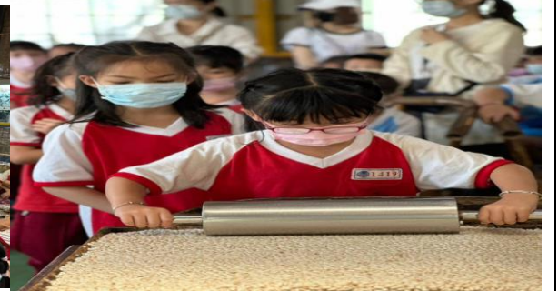
說明：戶外教育參訪