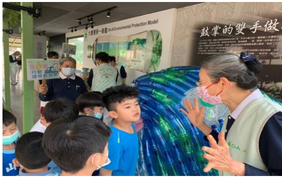
說明：環保志工講解