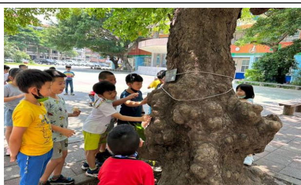
說明：大樹小花我愛你