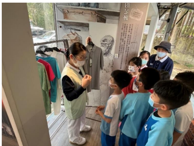
說明：項次 七 成果照片