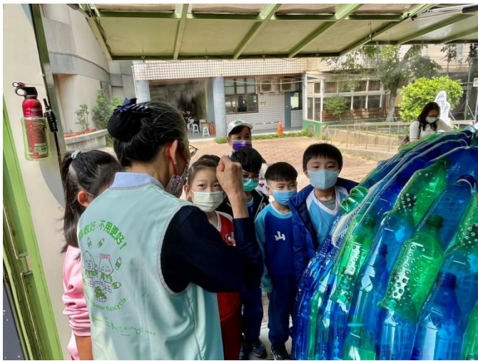
說明：項次 七 成果照片