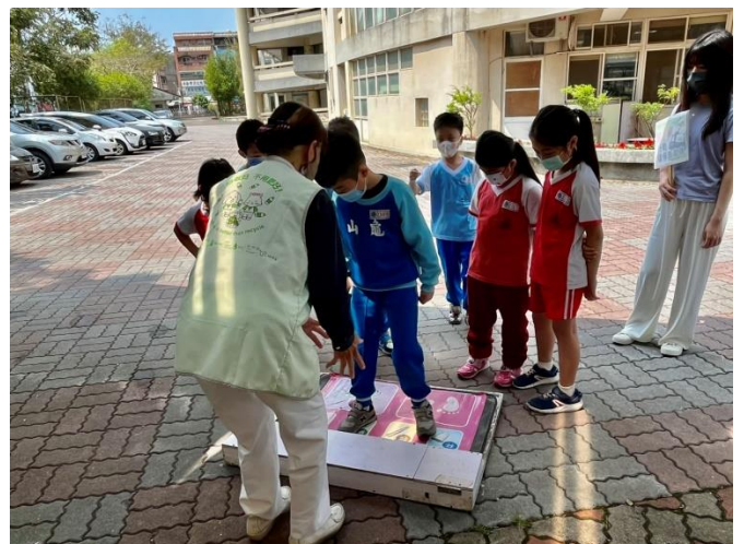
說明：項次 七 成果照片