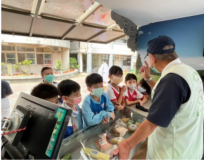
說明：項次 七 成果照片