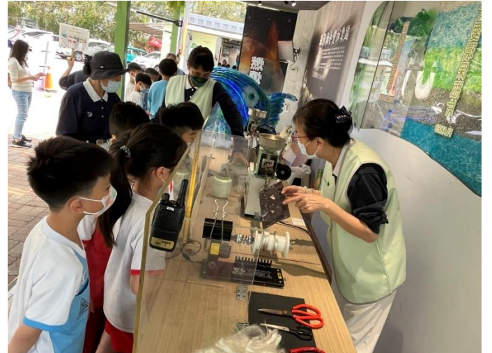
說明：項次 七 成果照片