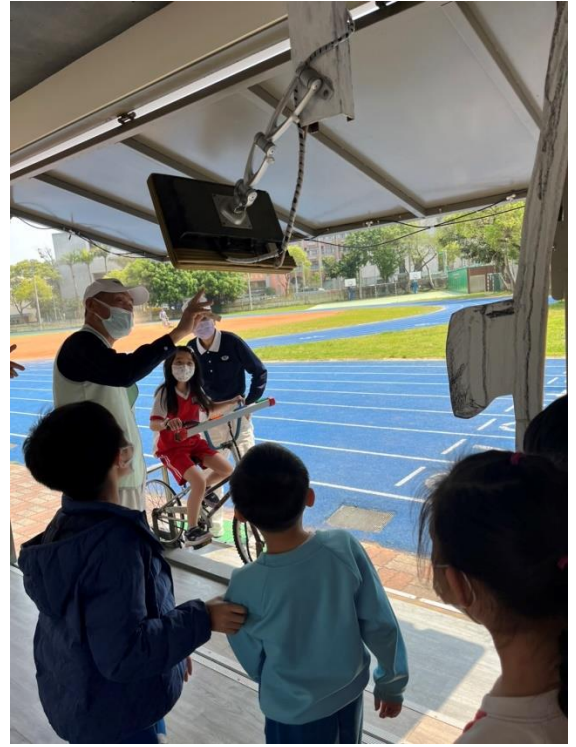
說明：項次 七 成果照片