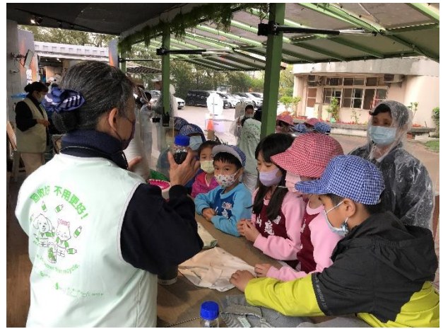
說明：項次 6 成果照片