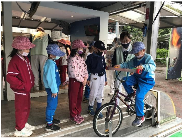
說明：項次 6 成果照片