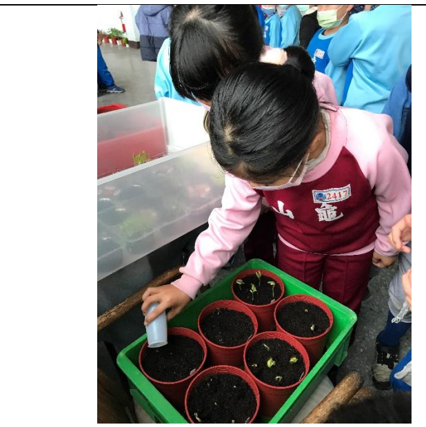
說明：項次 5 成果照片