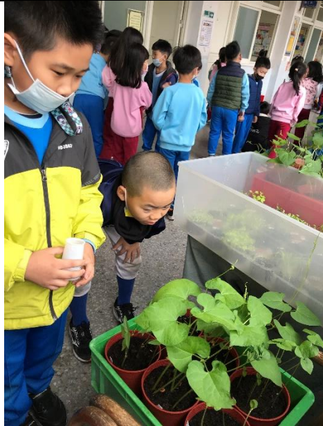
說明：項次 5 成果照片