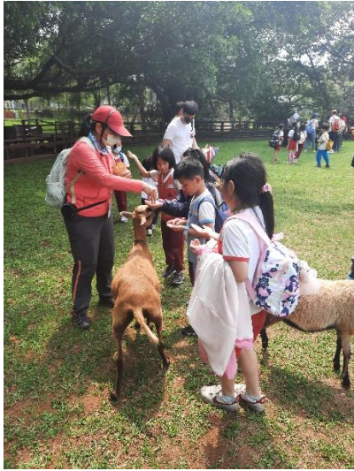
說明：項次 三 成果照片