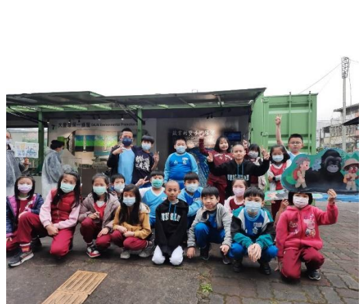
說明：項次 二 成果照片