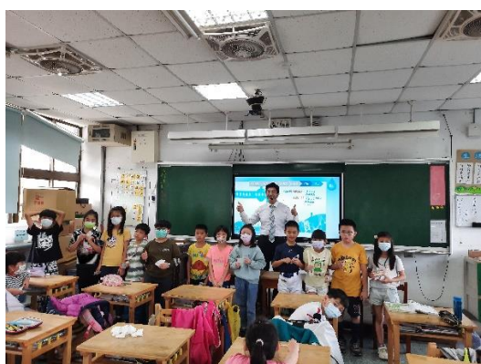
說明：項次 一 成果照片