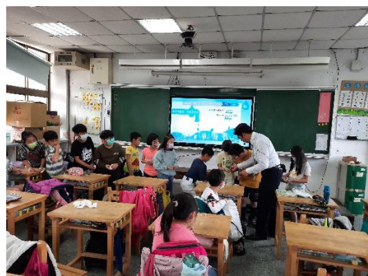
說明：項次 一 成果照片