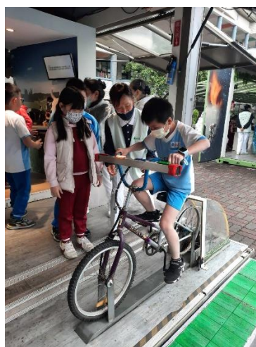
說明：項次 二 成果照片