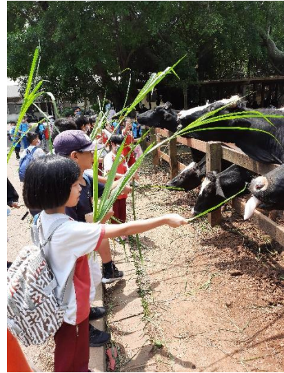
說明：項次 三 成果照片