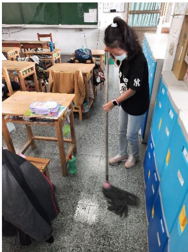
說明：項次 四 成果照片