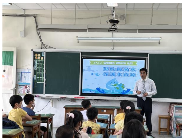
說明：項次 一 成果照片 以實際行動節約每滴水，保護水資源