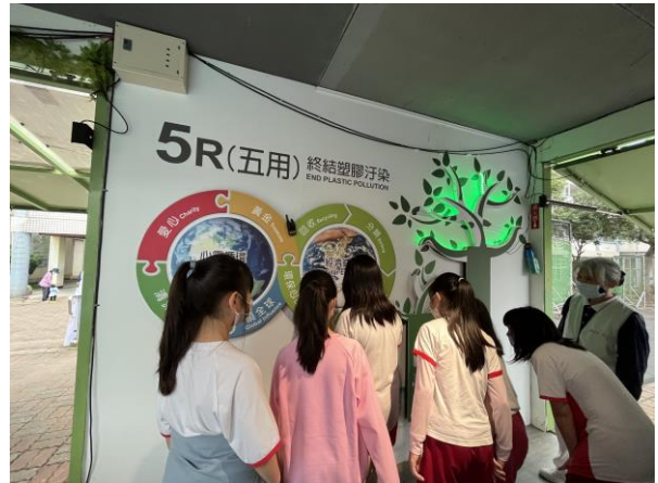
說明：項次 二 成果照片 推廣蔬食，認識蔬食的好處