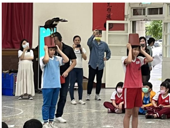
說明：項次 二 成果照片 回收寶特瓶製成環保紗