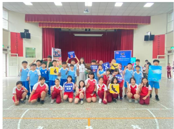
說明：項次 二 成果照片 完成學習單及心得分享