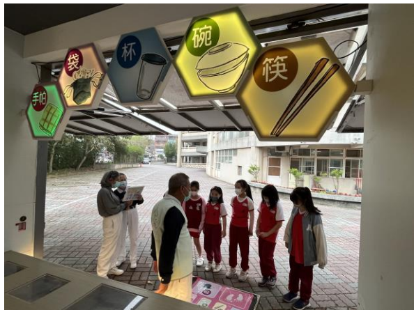
說明：項次 二 成果照片 認識碳足跡，力行低碳生活