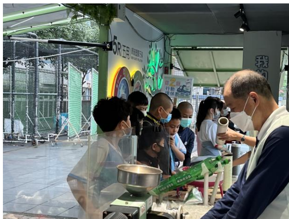
說明：項次 二 成果照片 認識環保五寶：杯、碗、筷、手帕、購物袋