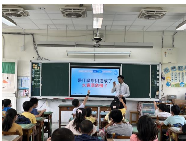
說明：項次 一 成果照片 認識水資源及面臨的危機