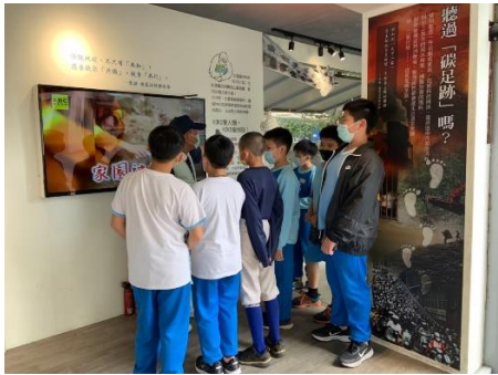
說明：項次 二 成果照片