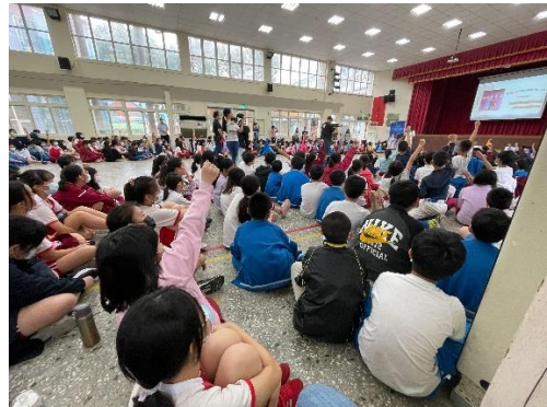
說明：項次 三 成果照片