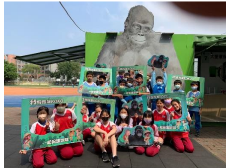
說明：項次 二 成果照片