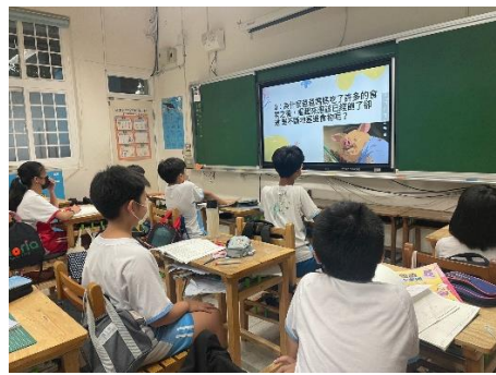
說明：項次 一 成果照片