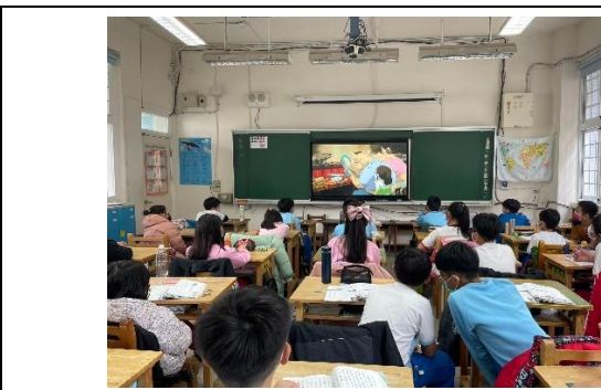
說明：項次 一 成果照片