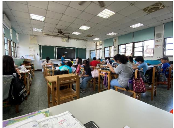
說明：項次 六 成果照片