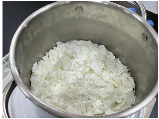
說明：項次_1_成果照片