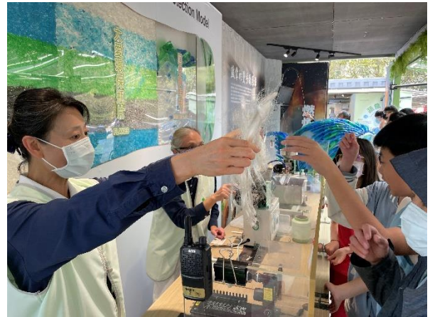
說明：項次_2_成果照片