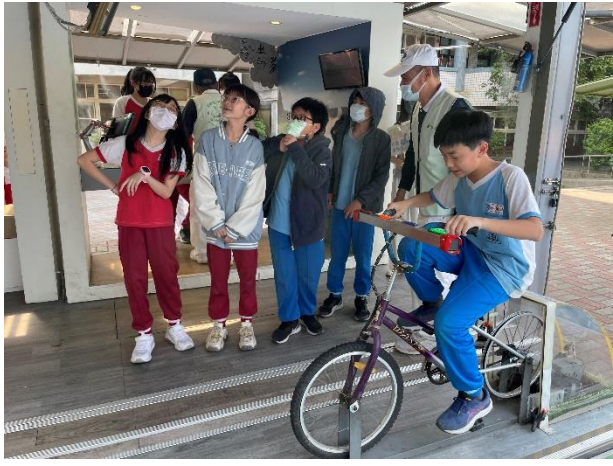
說明：項次 2 成果照片