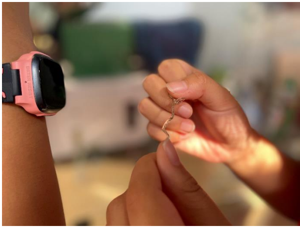
說明：項次 2 成果照片