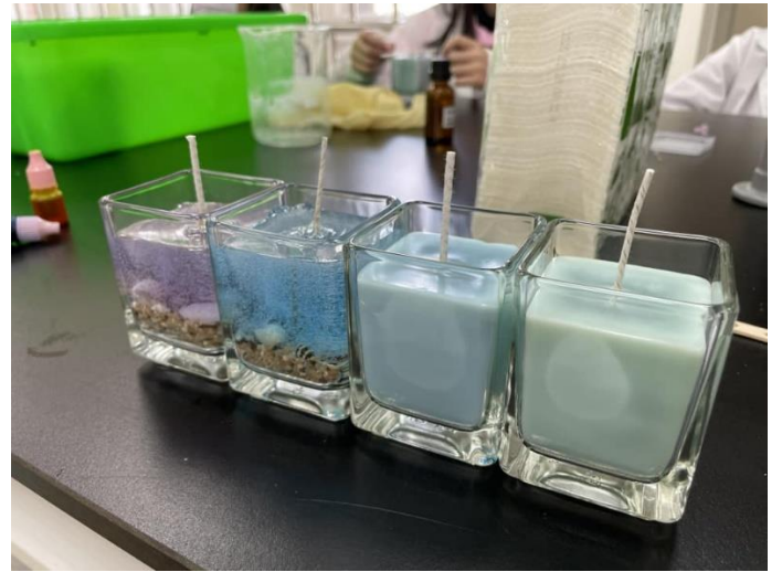
說明：項次_1_成果照片