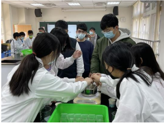
說明：項次_1_成果照片