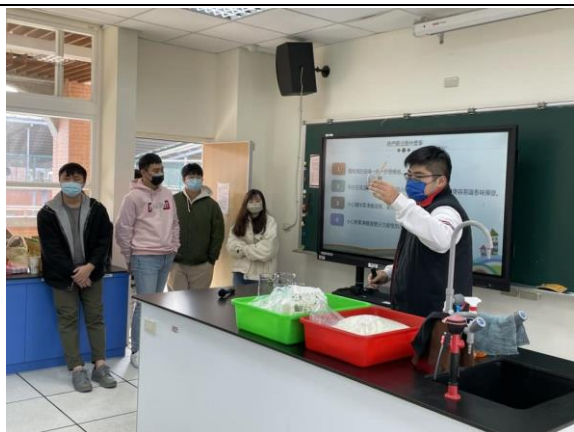
說明：項次 1 成果照片