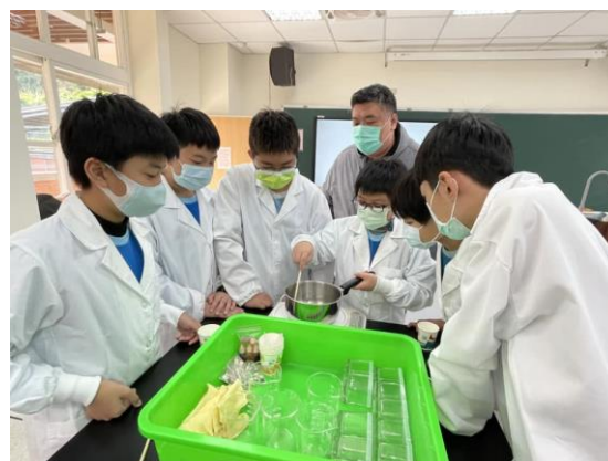
說明：項次 1 成果照片