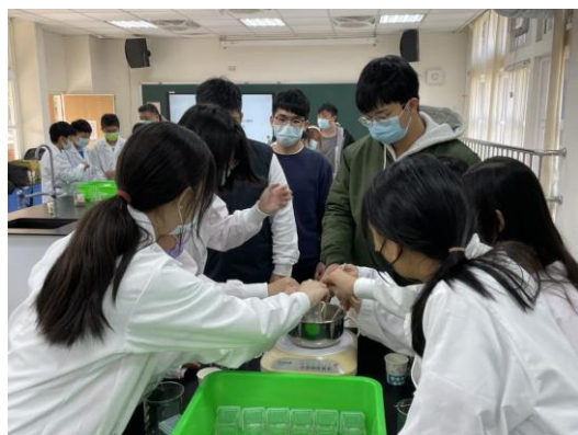
說明：項次 1 成果照片