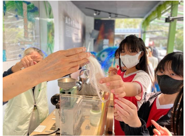
說明：項次 2 成果照片