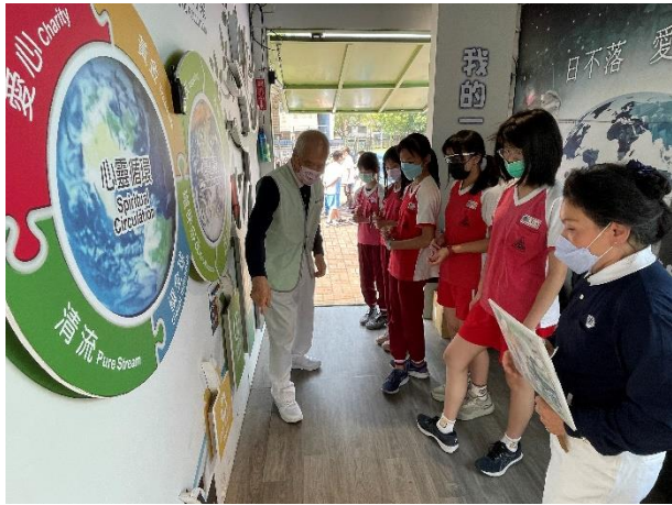
說明：項次_2_成果照片