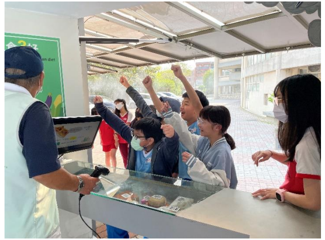
說明：項次 2 成果照片