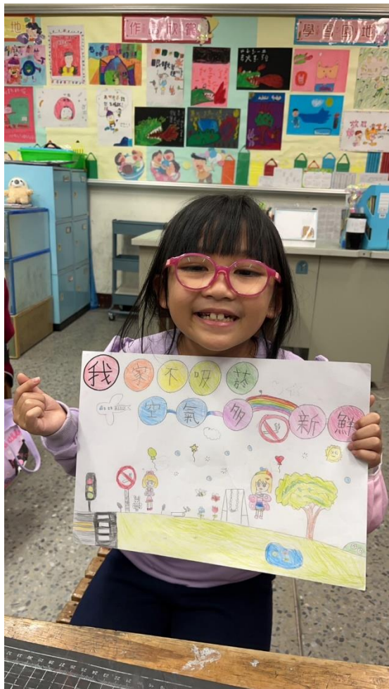
說明：項次 七 成果照片