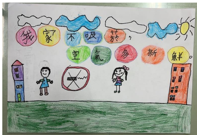
說明：項次 七 成果照片