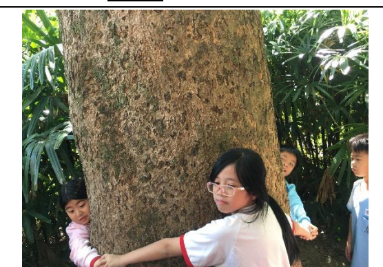
說明：項次 五 成果照片