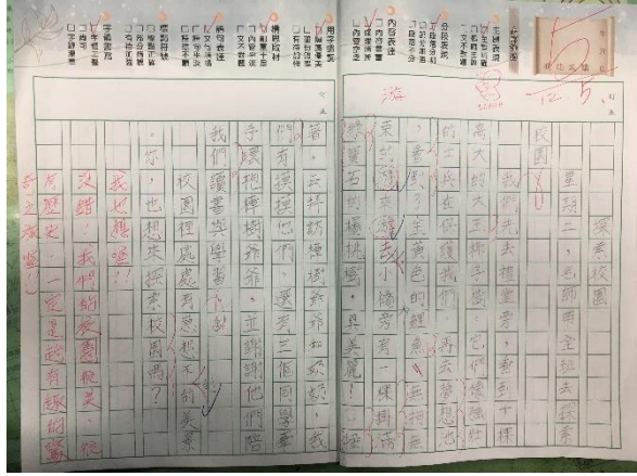
說明：項次 六 成果照片