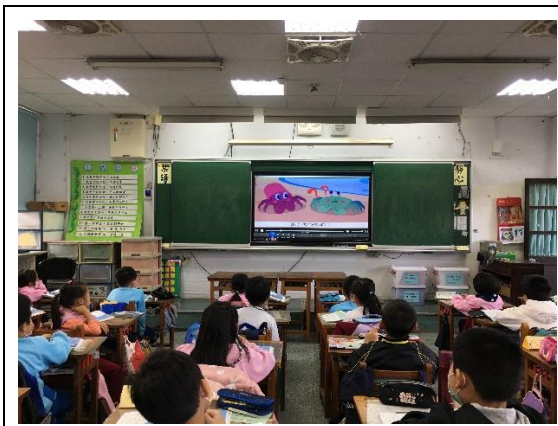
說明：項次 一 成果照片