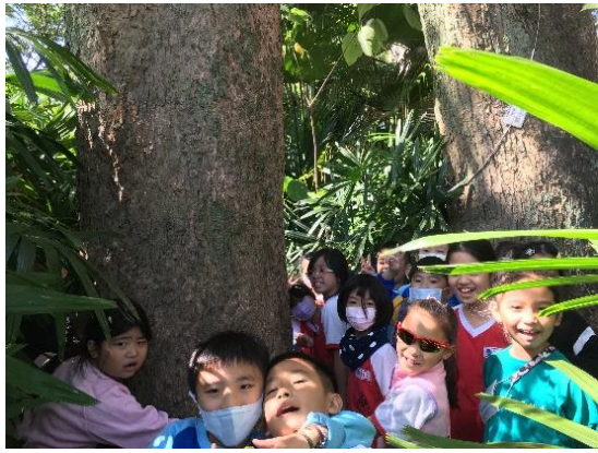
說明：項次 五 成果照片