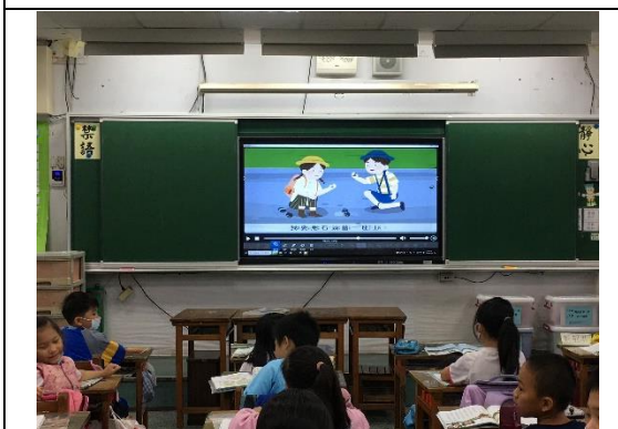
說明：項次 三 成果照片