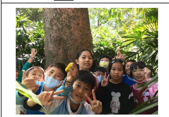
說明：項次 五 成果照片