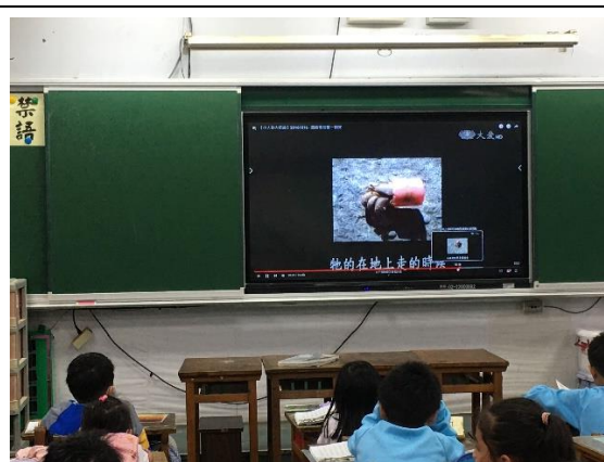
說明：項次 二 成果照片