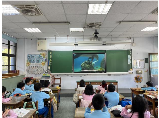
說明：項次 二 成果照片 海洋生物因誤食塑膠袋而喪命