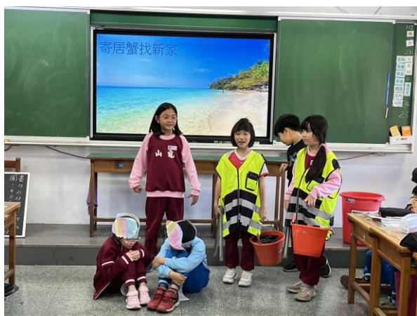
說明：項次 四 成果照片 小劇場~寄居蟹找新家 part1