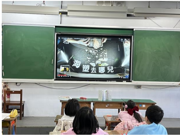
說明：項次 二 成果照片 認識海洋垃圾汙染