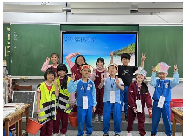
說明：項次 四 成果照片 小劇場~寄居蟹找新家 part2