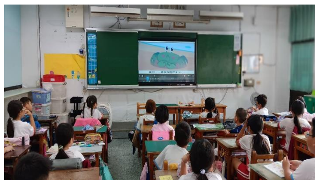
說明：項次 2 成果照片