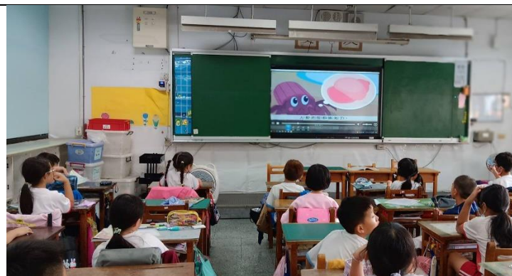
說明：項次 2 成果照片