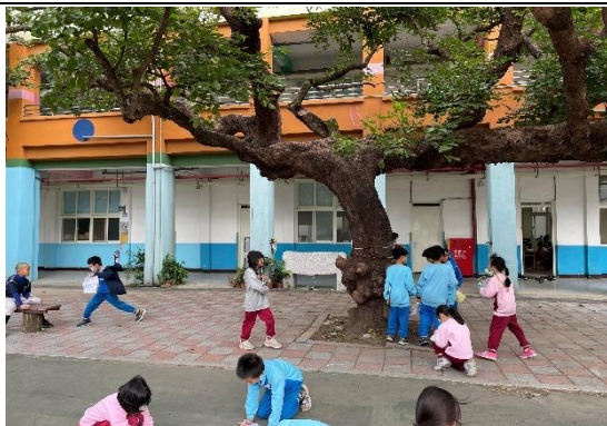
說明：項次 4 成果照片