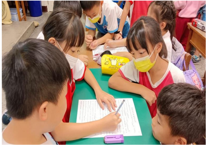
說明：四 2-1 消失的王者-北極熊，認識北極熊