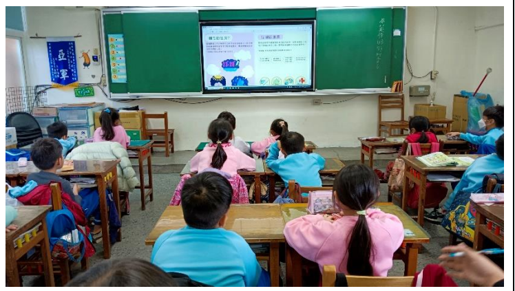
說明：五 1-2 珊瑚悲歌，學習單共做