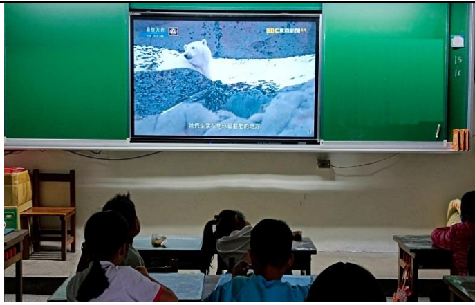
說明：三 1-1 消失的王者-北極熊，影片觀賞