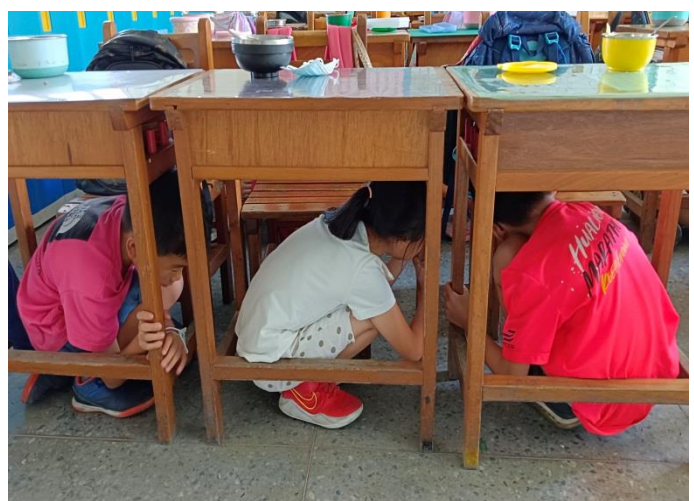
說明：二 2-1 防災演練