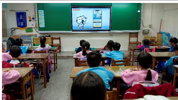
說明：一 1-2 天然災害-地震