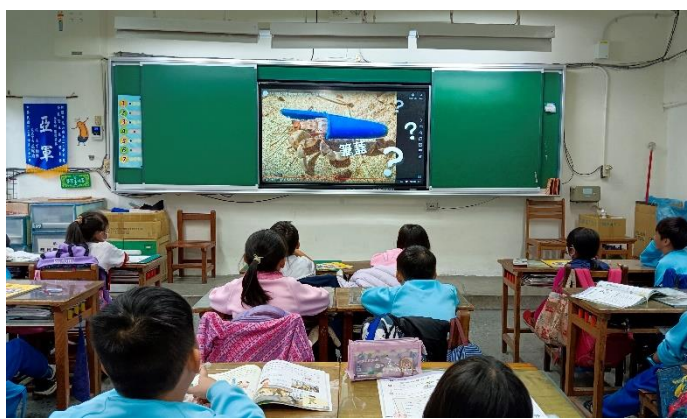
說明：六 2-1 珊瑚悲歌，寄居蟹的家呢？