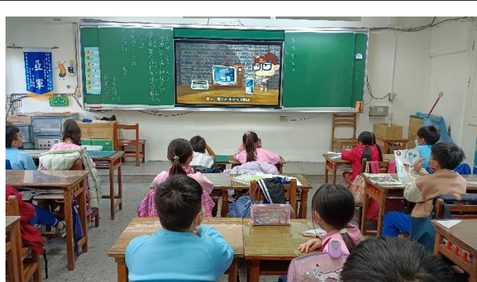
說明：一 1-1 天然災害-颱風