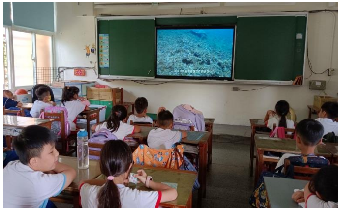
說明：五 1-1 珊瑚悲歌，影片觀賞