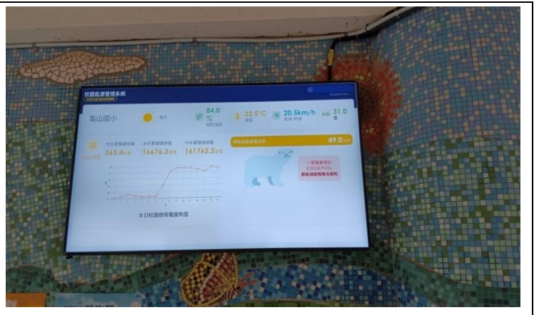
說明：三 1-2 消失的王者-北極熊，能源使用