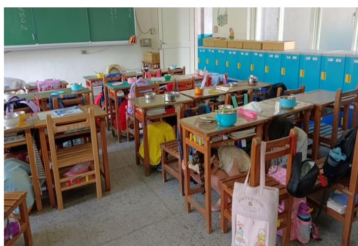
說明：二 2-2 防災演練