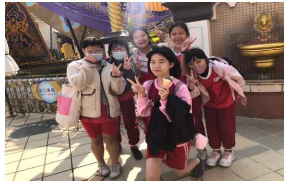
說明：項次 3 成果照片