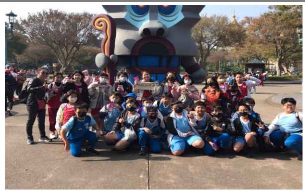
說明：項次 1 成果照片