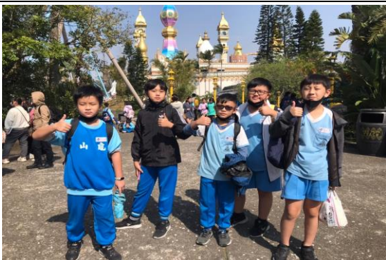
說明：項次 4 成果照片