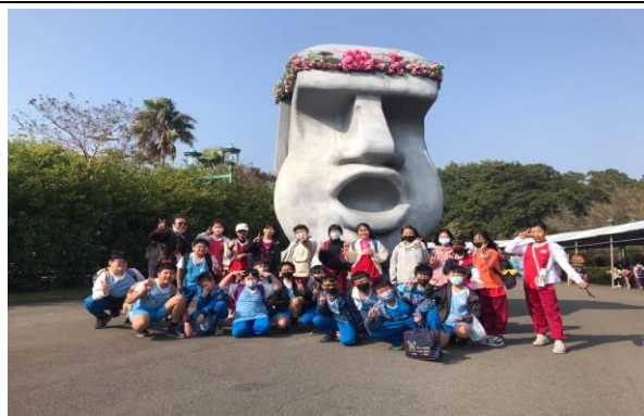
說明：項次 1 成果照片