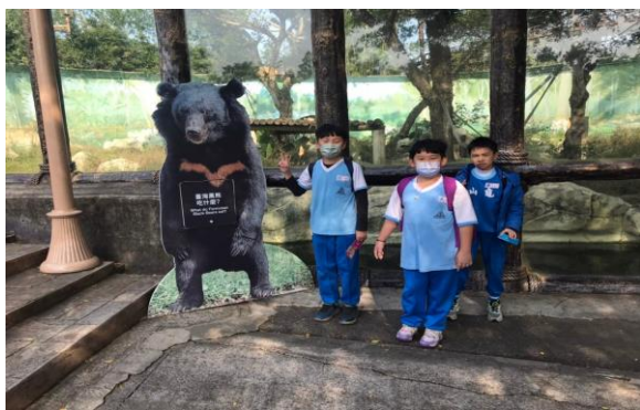
說明：項次 2 成果照片