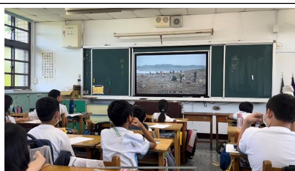
說明：項次一成果照片-影片欣賞