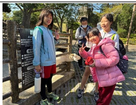
說明：項次四成果照片-六福村動物園參觀