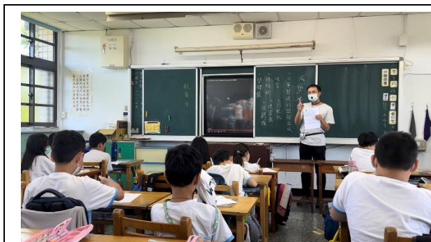
說明：項次一成果照片-減「塑」議題分享