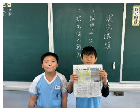
說明：項次二成果照片-環境議題報導分享