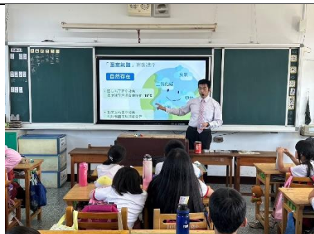
說明：項次三成果照片-環境教育入班宣導