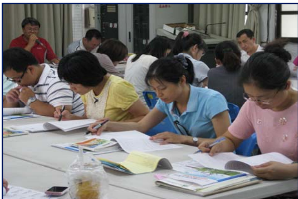
聚精會神參與討論