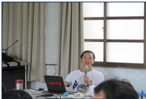
利用資訊設備說明