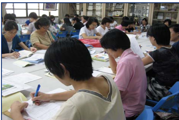
聚精會神參與討論