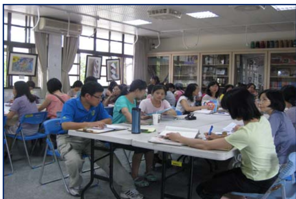
聚精會神參與討論