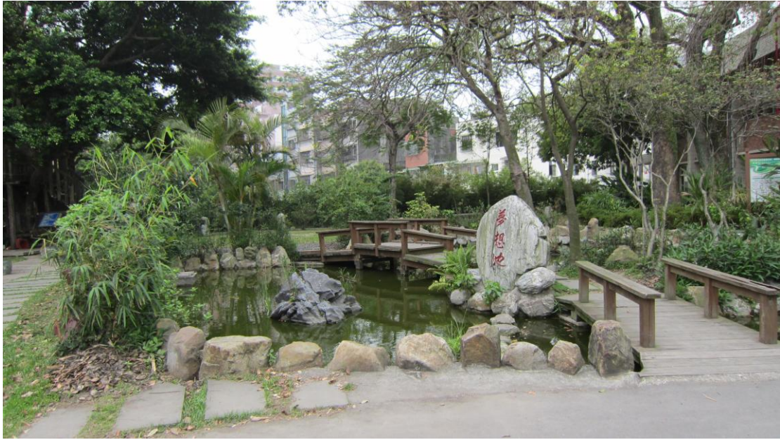
說明（一）：水生植物池外觀