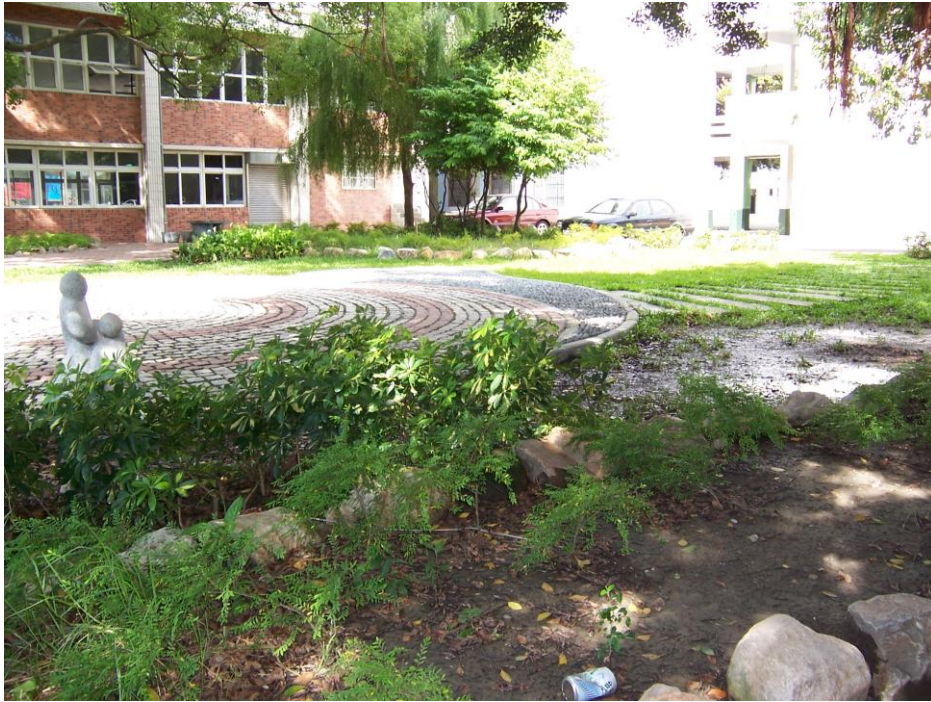
說明（一）：從停車場往禮堂方向拍攝