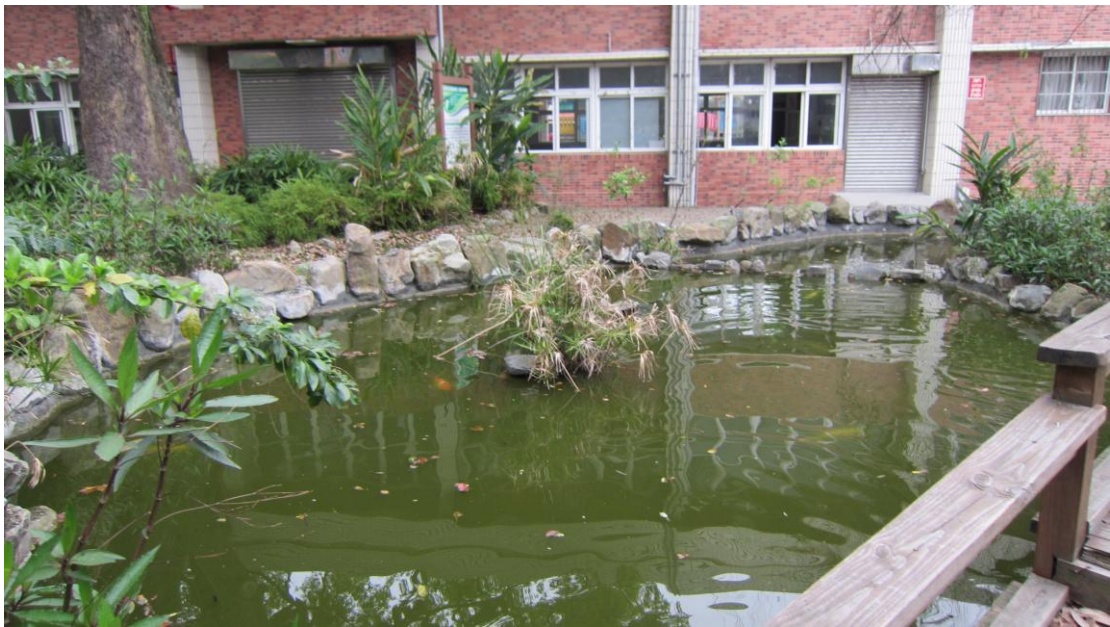
說明（四）：水生植物池外觀-----