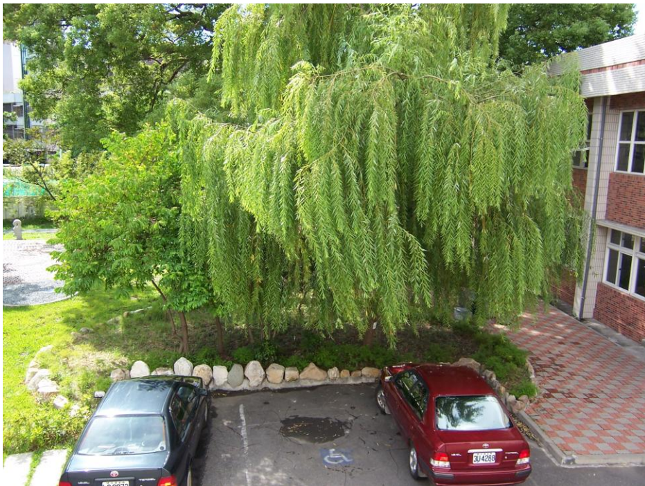
說明（二）：從 B 棟教室往柳樹、樟樹方向拍攝