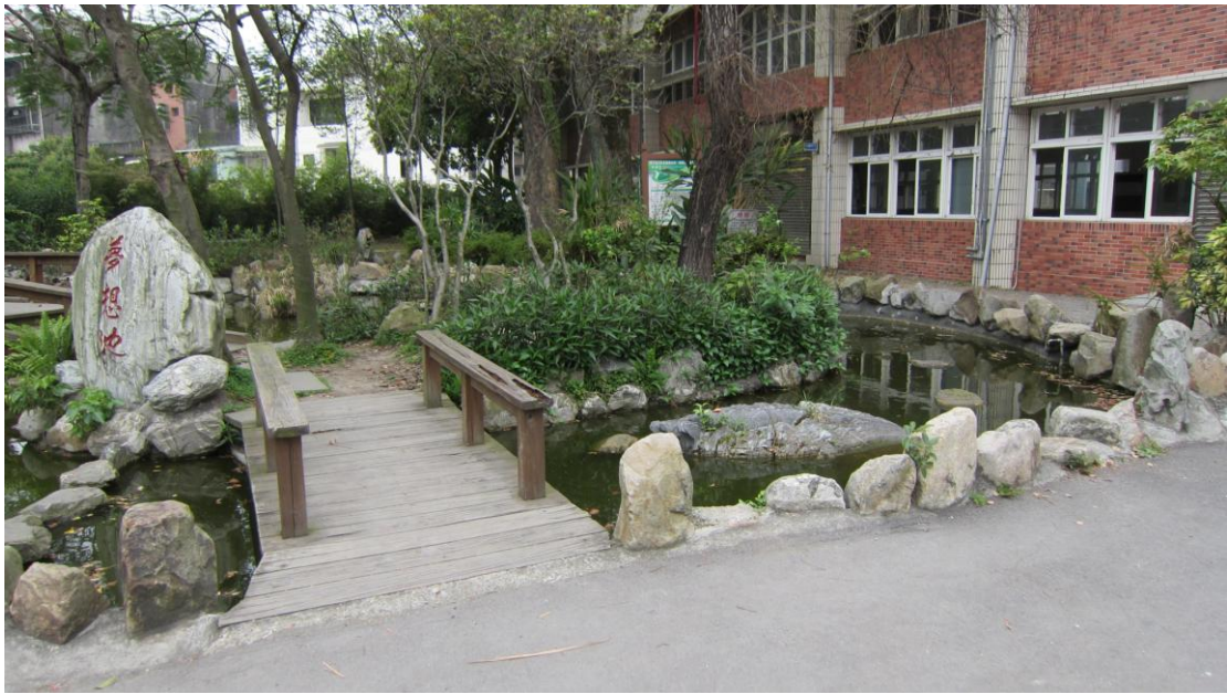
說明（三）：水生植物池外觀