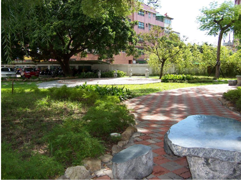
說明（三）：百碎磚學習步道