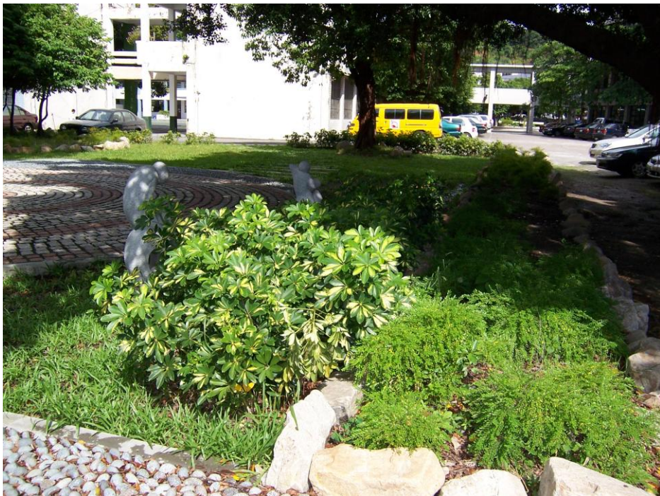
說明（四）：鵝卵石學習步道