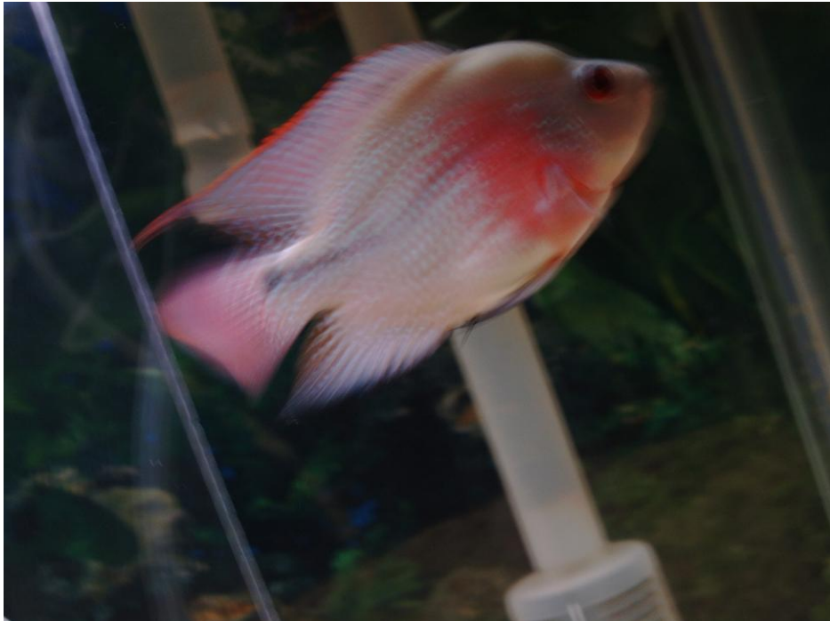
說明（二）：水生植物池飼養之魚類