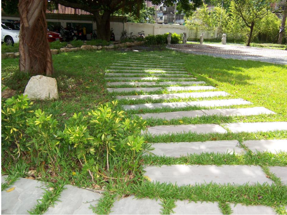
說明（一）：從 B 棟教室往機車停車棚方向拍攝