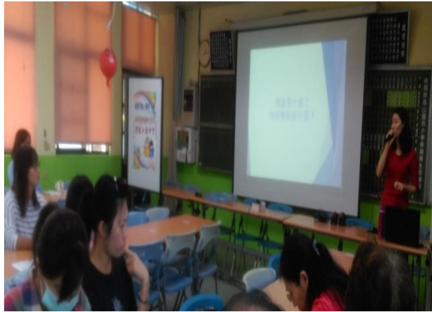
107.11.14 辦理特教知能教師研習 初談情緒障礙—認識與相處之道