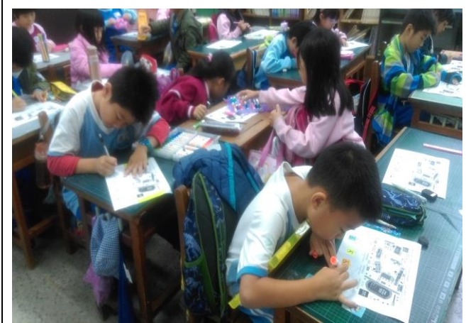
2 年級學生繪製 Accessible Gueishan 學習單