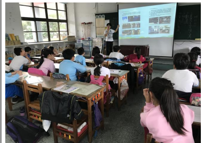
4 年級老師進行無障礙設施宣導