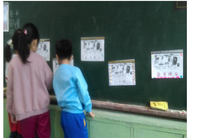
展示表現優秀的學習單作品