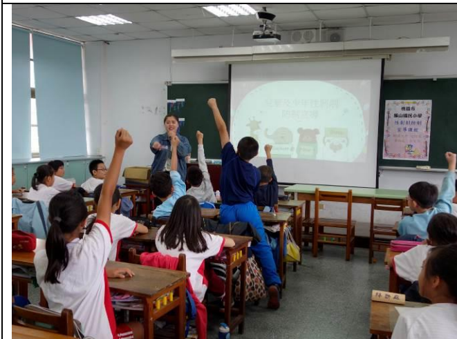
進行入班宣導—五年級兒少性剝削防制