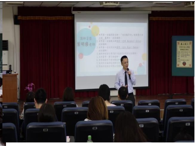
107.11.10 辦理親職講座— 從情緒管理談親師生互動之重要性