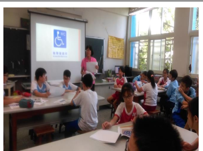
藝文老師引導 5 年級學生進行繪製無障礙標誌