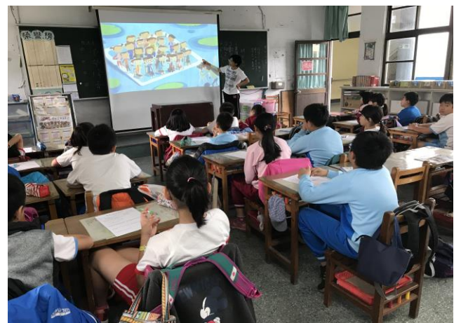
4 年級特教繪本閱讀「每一個都要到」