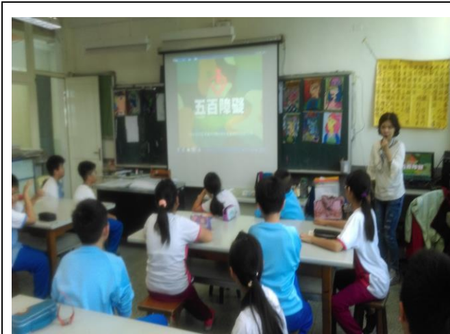
5 年級學生觀賞「五百障礙」影片