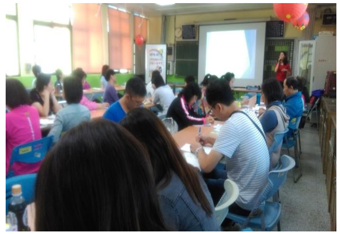
107.11.14 辦理特教知能教師研習 初談情緒障礙—認識與相處之道