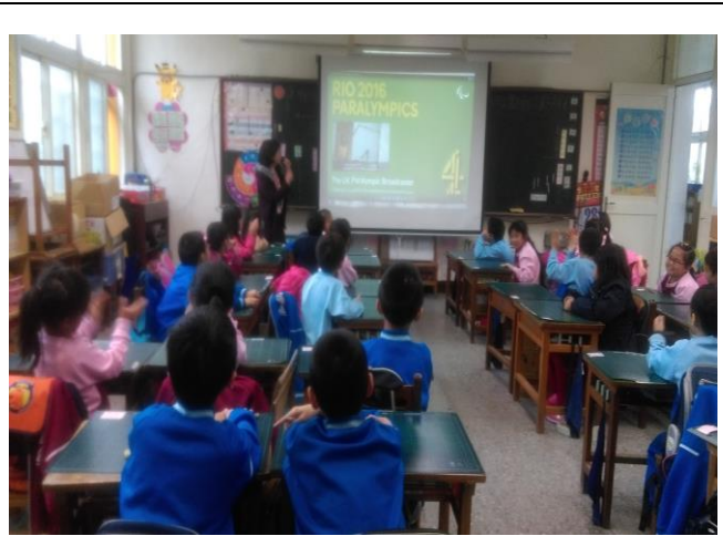
特教影片觀賞「We are the Superhumans Rio Paralympics 2016 Trailer」