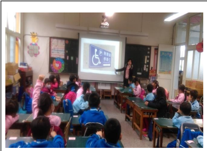
特教組長介紹無障礙標誌