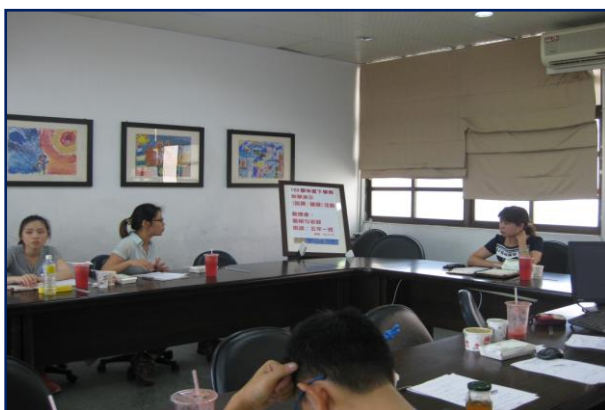
提出檢討改進建議