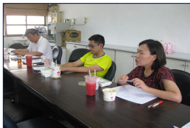
夥伴分黃老師享觀課心得