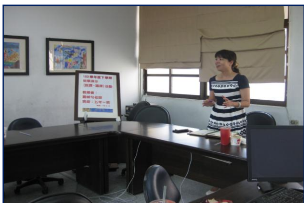
校長主持備課、說課、議課活動