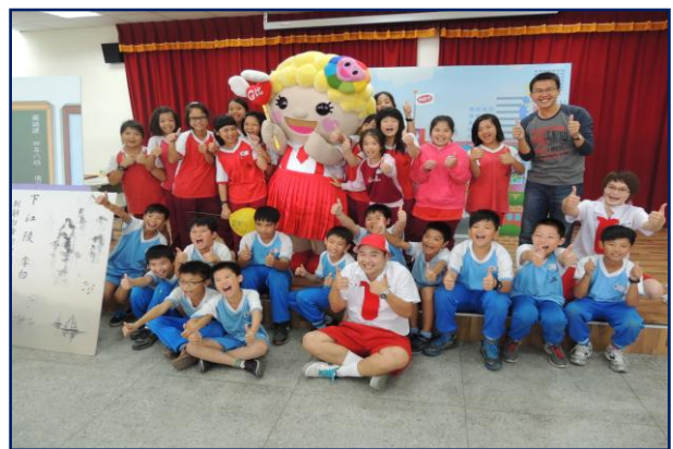
班級與演出人員合影