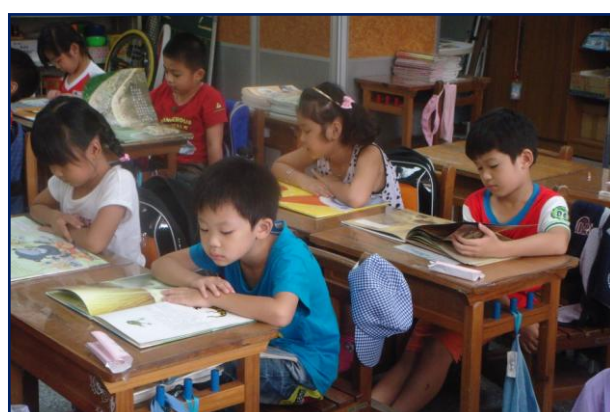
小朋友專注於書本