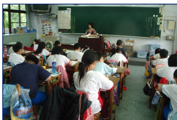
小朋友專注於書本