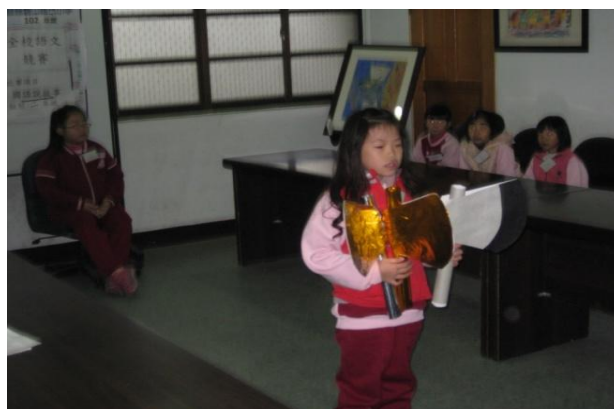
低年級說故事比賽