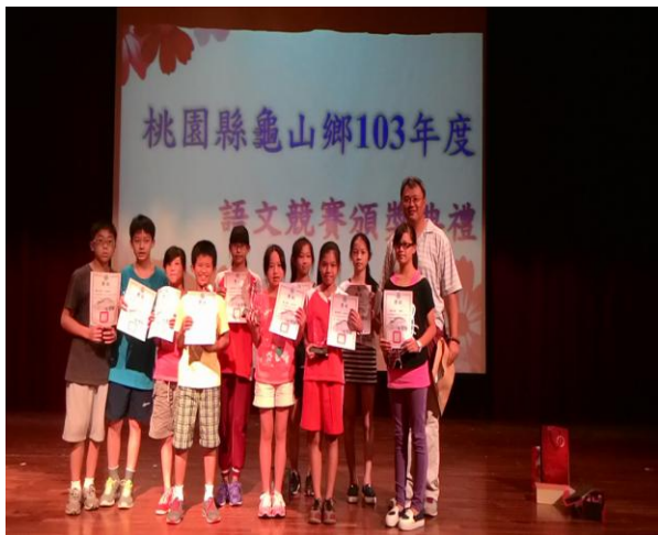
鄉語文競賽頒獎典禮