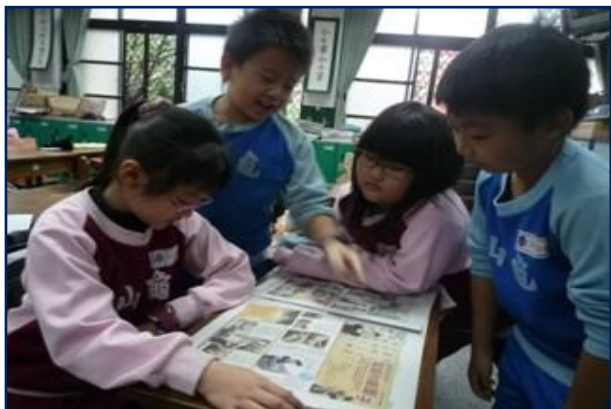
將國語日報閱讀活動帶入教學中