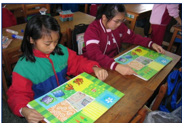
視覺藝術課程融入閱讀