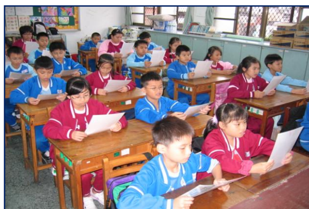
自然科簡報閱讀提昇學生課外閱讀知識