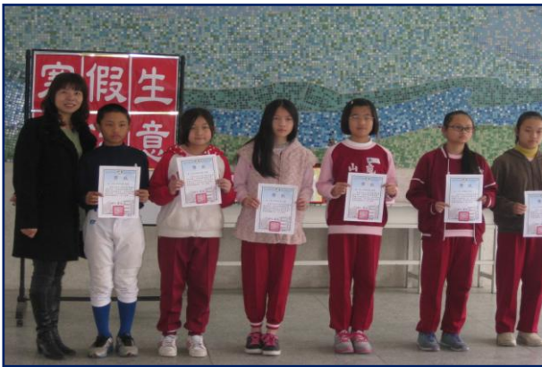
校長與得獎者合影