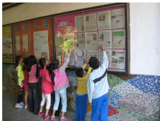
閱讀每日國語日報