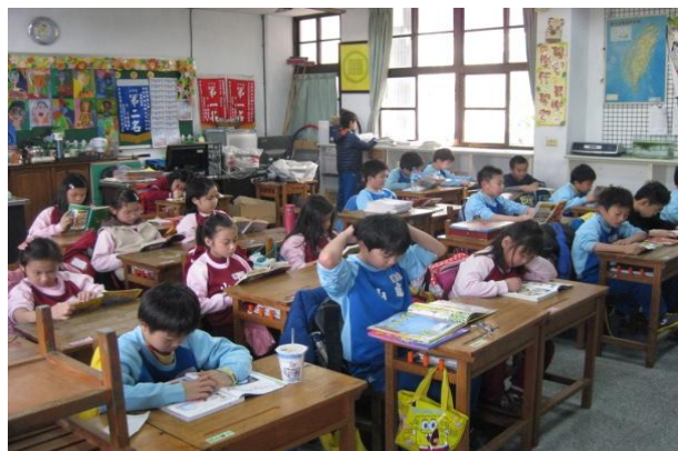
小朋友專注於書本