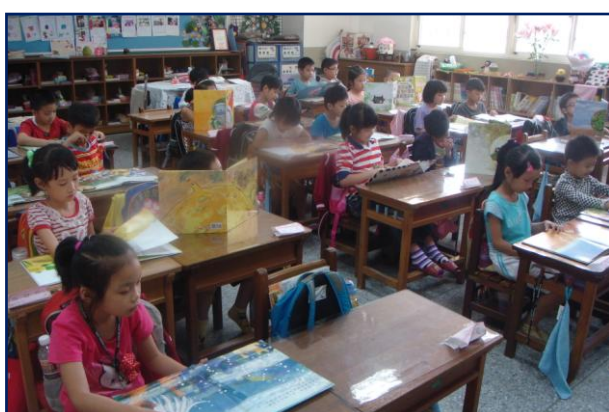
小朋友專注於書本