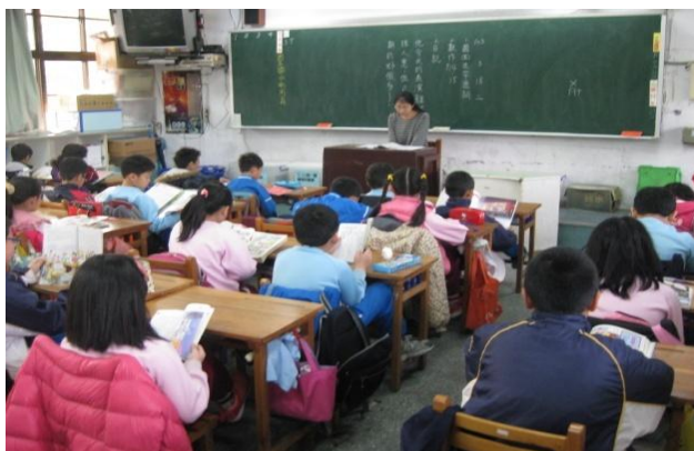
教師帶領晨光閱讀