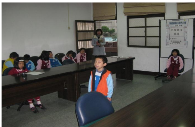
低年級說故事比賽