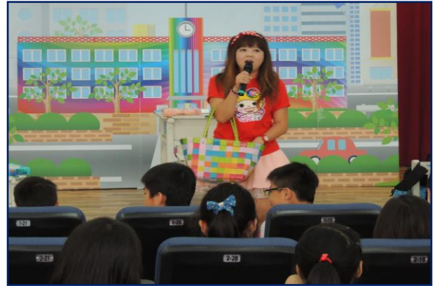
活動主持人賣力宣導