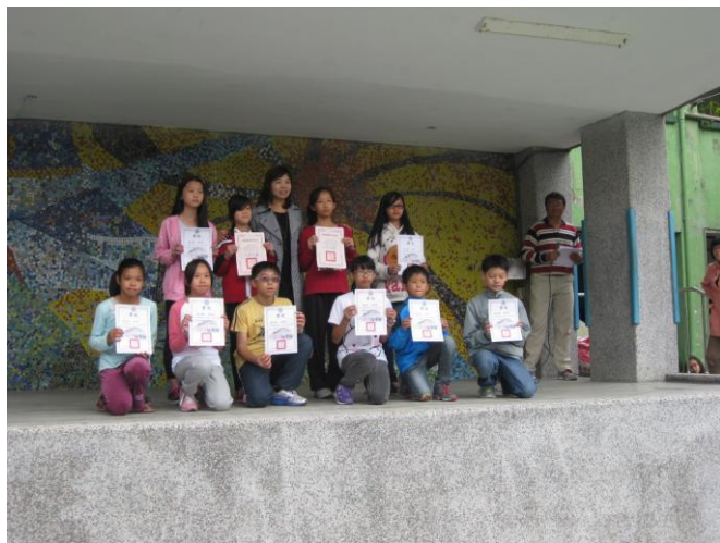
鄉語文競賽優勝者於兒童朝會表揚