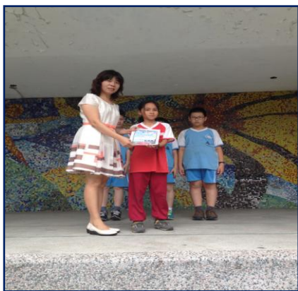
全校前 3 名頒獎