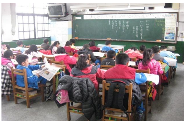
小朋友專注於書本