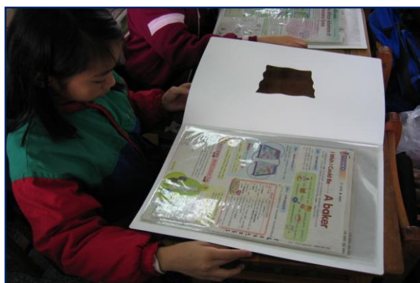
英語教學融入閱讀課程