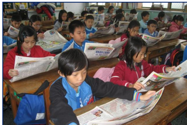
將國語日報閱讀活動帶入教學中