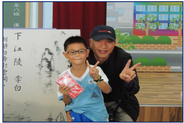
學生答對得到獎品