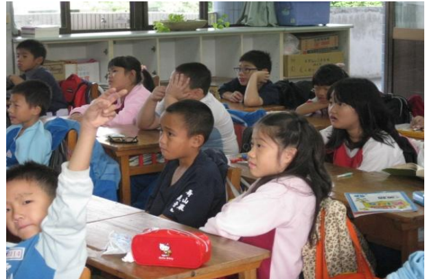
小朋友舉手回答問題