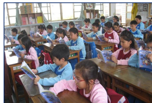
全班一起閱讀共讀書箱書籍，教師進行討論