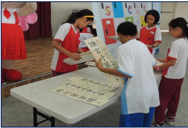
學生合作找出正確答案