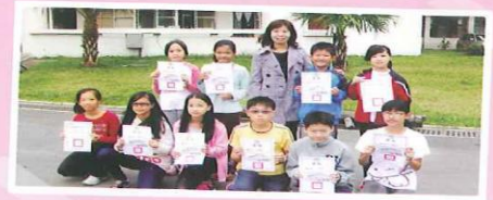
103學年度本校語文代表隊榮獲龜山鄉語文競賽，學生組第一名、團體第二名