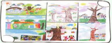
1-4 高銘滋、陳采菁、陳豆慈、劉潔 劉家樺、林宛蓉 指導老師：謝逸蕪