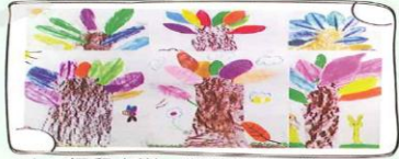
1-5 拓印大樹 指導老師：蔡秀君

1-7 官宥辰 指導老師：游如芬 有一天，大象很驕傲的說：「我力大無窮，是森林中的大力士，誰都比不上我！」小老鼠說：「我才不相信，我們來比拔河，看誰的力氣比較大。」大象笑哈哈，說：「你們又瘦又小，我又高又壯，跟我比是自不量力。」比賽開始，大象拔得汗流浹背、筋疲力竭，卻還是輸給了小老鼠。小老鼠開心的說：「這就是團結力量大啊！」從此，大象再也不敢小看小老鼠了。