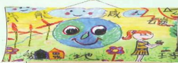
環保繪畫 3-8 呂芳毅 指導老師：佘同傑