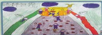
羊世界 2-3 林信儒 指導老師：游鳳英