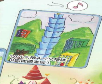
101大樓4-4 文楷瑋 (劉建國老師)