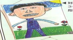
好朋友的畫像 3-5 甄瑞安 指導老師：蘇玉文