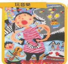
玩音樂 繪畫類 國小低年級組 佳作 二年一班 杜以晴 指導老師：文麗芳