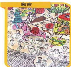
廟會 繪畫類 國小高年級組 佳作 五年一班 許珈禎 指導老師：蕭幀勻