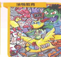
填鴨教育 漫畫類 國小高年級組 佳作 六年一班 簡 彌 指導老師：陳姿綺