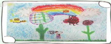
1-8 游以芮 花仙子的異想世界 指導老師：鄭秀齡