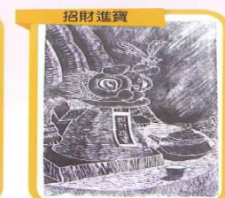
招財進寶 版畫類 國小高年級組 佳作 五年六班 張雅涵 指導老師：羅朝輝